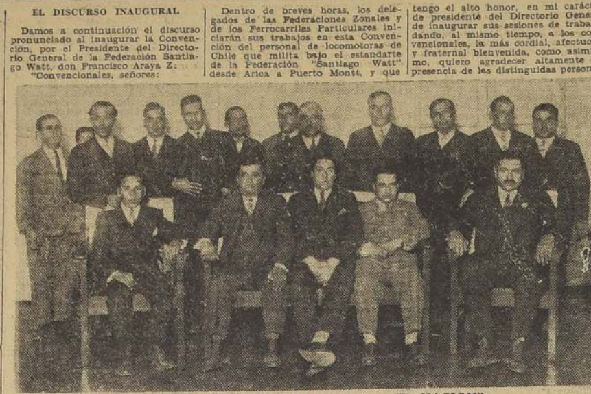
Grupo de delegados ferroviarios en su visita a "La Nación"

Mañana a las 8, continuarán los estudios de las diferentes comisiones, y en la tarde, se reunirá la Convención en asamblea plena, para tomar conocimiento de los informes y conclusiones a que arriben, para dar su veredicto definitivo.