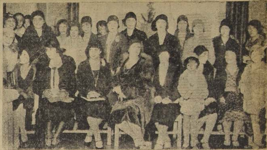
Grupo de damas que asistieron al aperitivo ofrecido por la Sociedad Laboratorio "Aurentia", en su elegante local de la calle Merced, con motivo de inaugurarse dicho establecimiento.