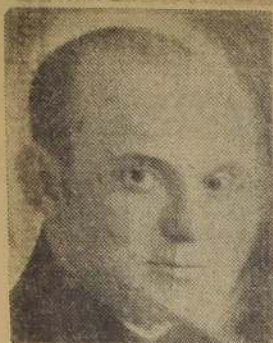
PARA MAYORES Y MENORES