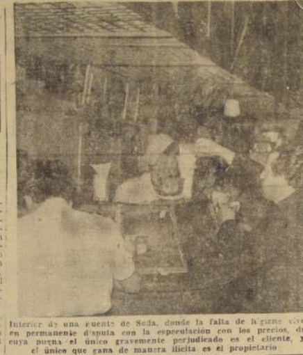
Interior de una fuente de SODA, donde la falta de higiene vive en permanente disputa con la especulación con los precios, de cuya puna el único gravemente perjudicado es el cliente, y el único que gana de manera ilícita es el propietario.

Castellanos, lunes 18. Dibujo técnico, martes 19. Física, miércoles 20. Matemáticas, jueves 21. Prueba de especialidad, viernes 22 del mismo mes.