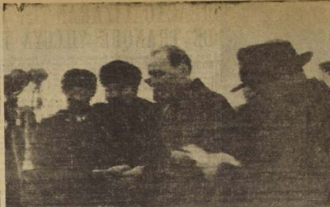
BUDAPEST.—El Primer Ministro de China Comunista, Chou En-Lai (segundo de la izquierda), escucha un discurso de bienvenida que pronuncia su colega húngaro, Janos Kadar (a

Dicho decreto y el reinado de terror que se dice le siguió se produjeron después que la policía, apoyada por técnicos soviéticos, abrió el fuego sobre manifestaciones obreras el viernes