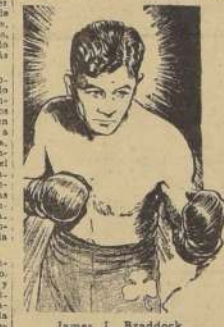
James J. Braddock.

El galés Tommy Farr, otro de su misma hechura y... enemigo a muerte del ex campeón mundial de los pesos... Una vez quisieron dirimir a puño limpio superioridades. Tony Cannoneri y Mickey Walker, bebían para tener valor en el ring. (Una nota de JIMMY CANNON) NEUVA YORK. — El negocio del boxeo es brutal más el pugilista puede ser espiado y poseer honor, pero esto ya es antiguo en nuestros tiempos. Hay