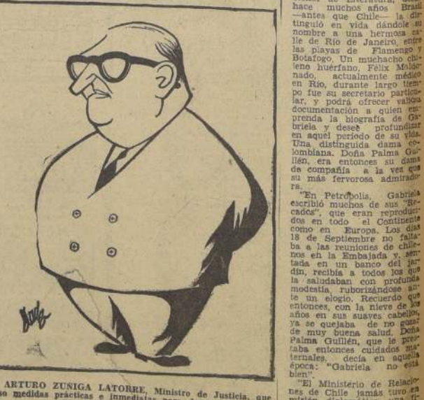
DON ARTURO ZUNIGA LATORRE, Ministro de Justicia, que dispuso medidas prácticas e inmediatas para descongestionar la Cárcel Pública de Santiago.