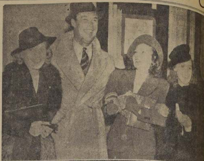
Arriba Wayne Morris, rodeado de las tres hermanas Lane, parece sentirse muy cómodo. Abajo, Louise Rainer en el momento de hablar por radio

con sorprendente angustia que la mayoría de los comensales eran católicos y que como era viernes, mantenían escrupulosamente las prescripciones rituales de su religión para ese día. Inmediatamente, con el trinitario apresuramiento que es de imaginarse, se procuraron los elementos substitutivos indispensables para subsanar el inconveniente, lo cual se logró mediante diligentes proveedores de la localidad de San Diego, situada a 18 millas de distancia