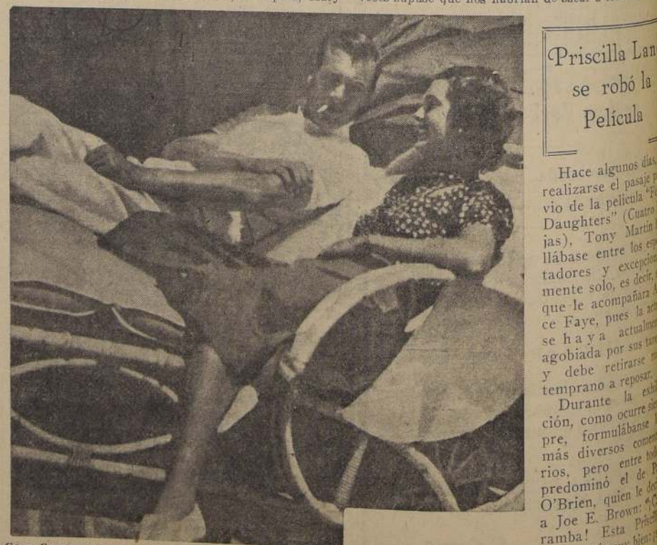
Gary Cooper y su esposa Sandra Shaw. Gary dice que Sandra es la mejor y más bella esposa del mundo

Jack Benny se halla acosado por los coleccionistas de autógrafos. Es un mal irremediable en Hollywood, al que nadie logra sustraerse. Mientras tanto, su esposa, Mary