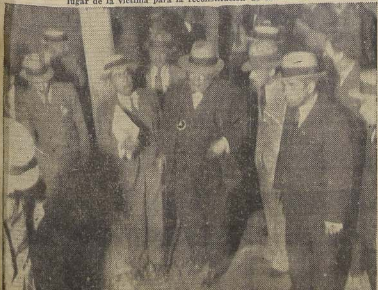
"Aquí es", dijo la viuda al llegar al lugar del crimen. "En verdad, no me acuerdo bien... Parece que fué aquí". Y estaba muy emocionada.