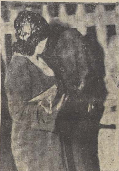
Pasado Los Leones, al tomar la calle Margarita.

—Creo que volví... No sé... No podría recordar-