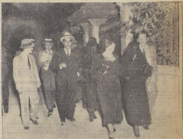
Doblando por Los Leones, camino del teatro del crimen.

lo... Estaba tan nerviosa... No estoy segura; pero no me parece... Recuerda que pidió que llamaran a la Asistencia o le avisaran a su hija; pero como nadie le hiciera caso, siguió corriendo. Al llegar a la esquina de Los Leones se cayó en una acequia; se levantó y siguió.