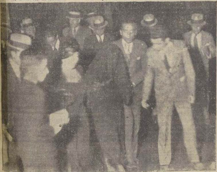
Por la calle Margarita, pasado Kornier, avanza lentamente. Aún nadie ha tomado el lugar de la víctima para la reconstitución de la escena.