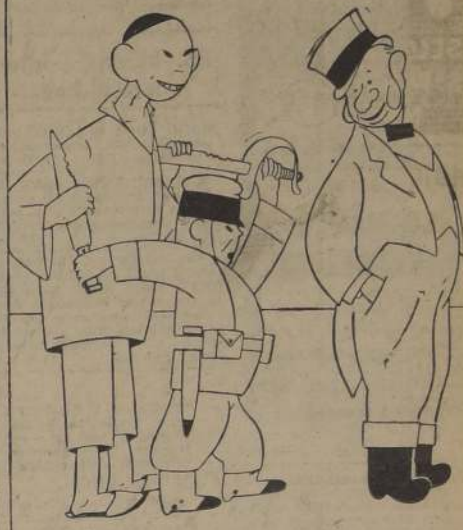
JOHN BULL. — ¿A qué sufrir por tu inquina, mientras te sobe la China?