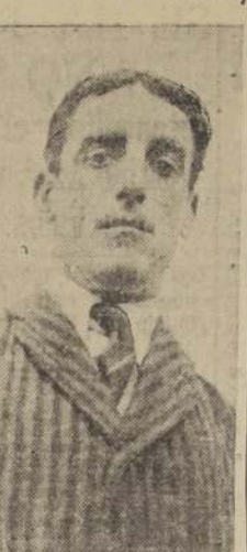
Juan C. Bertone, el popular entrenador uruguayo que anoche llegó al país