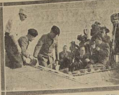
El Duce rodeado por los obreros, inicia la demolición de la sección romana en donde se construirá la Casa del Littorio