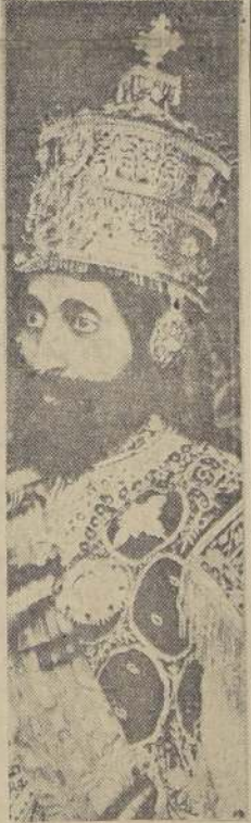
Haile Selassie, emperador de Etiopía

HAY QUE HACER DEMOSTRACIONES DE FUERZA PARA NO USARLA ROMA, 9. — (U. P.) — El informe del diputado Biagio Pace, que acompaña el presupuesto del Ministerio de Relaciones sometido a la Cámara de Diputados, dice: "Italia no puede permanecer indiferente ante los sangrientos incidentes, y que a menos que se les haga frente en forma adecuada, pondrían en grave peligro la integridad de Eritrea y Somalilandia".