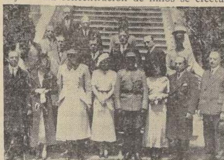
Las Embajadoras Espirituales del Rotary Club, durante su visita a la Escuela Militar

Las Embajadoras Espirituales visitaron la Escuela Militar. — Conferencias en las escuelas habrá en el día de hoy. — La concentración de niños se efectuará en noviembre