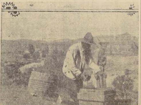
Lavando oro en la batea ("challa")

El intenso trabajo de reconocimiento que se hace necesario para llegar después a una explotación garantida, lo ha emprendido ya el actual Gobierno y figura dentro del plan de industrialización elaborado por el Ministro de Fomento, señor Navarrete. Cuando el Ministro estuvo aquí pudo observar el adelanto de las labores y dispuso lo conveniente para su prosecución intensificada. Por eso hemos visto en Churumata, repartidas en los extremos del mineral, tres banderillas chilenas, que se destacan como vigías ondulantes sobre los campamentos de los Ingenieros del Estado, que han venido a estudiar la realidad del presente y las posibilidades del porvenir. Mientras tanto, en Andacollo han echado a vuelo las campanas de la esperanza y todos piensan vestir, a corto plazo, el traje de minero de una prodigiosa fortuna... — El corresponsal especial.