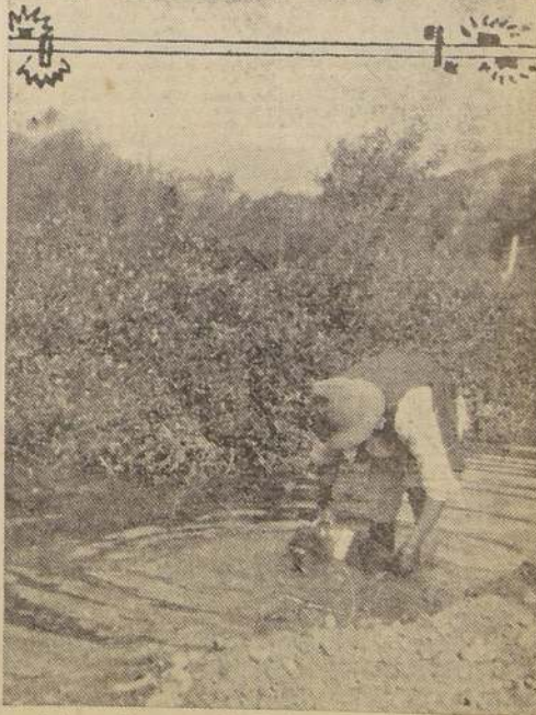
Labores de oro en la Quebrada de "Maitencillo".

numerosa concurrencia, esta tarde en este teatro. El Club de Señoras invita a todas las personas que deseen asistir. La entrada será libre. Se anuncia para mañana la exhibición de la espléndida película hablada en francés "Un capricho de la Pompadour". El sábado: "Arsene Lupin". Se invita para esta tarde muy especialmente al Hon. Cuerpo Diplomático.