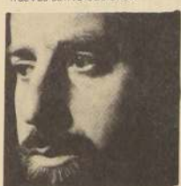
TARUD Declinó ayer pronunciarse sobre las declaraciones hechas por los dirigentes comunistas respecto a la naturaleza de los Partidos "aliados" del Radical, expresando que las declaraciones sobre la Unidad Popular debían hacerlas los dirigentes de los movimientos que los apoyan. Por el momento, tiene suspensas sus giras y actos de proclamación.

que resulta inexplicable esta actitud, ya que los dirigentes de la Asociación estaban informados de que hoy en la tarde se tratarían estos problemas, sin que fuese necesario arrastrar al personal a posiciones extremas.