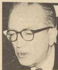
BALTRA "A punto de la designación"