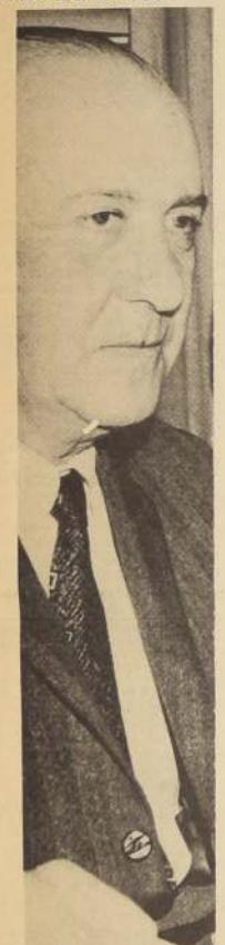
JASPARD. Profundo silencio ante nuevo capítulo del caso MIR.

Acto seguido subieron a un automóvil y emprendieron la fuga mientras el dependiente del servicio procedía a dar aviso a Carabineros. De inmediato llegó un vehículo policial hasta el lugar. Se obtuvieron las señas de los asaltantes y se emprendió la persecución. A la altura del