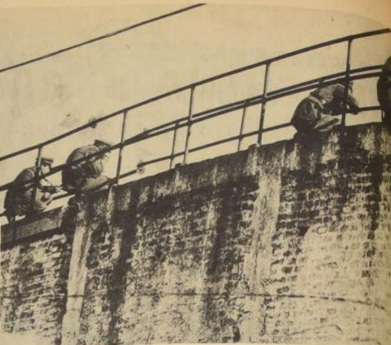
AGAZAPADOS sobre las murallas y con sus armas listas, vigilantes de la cárcel de Curicó observaron durante 17 horas a los amotinados.