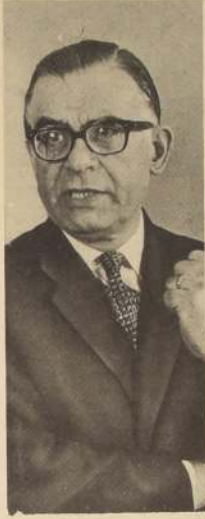
TOMIC En Villa Alemana inicia diálogo con Provincia de Valparaíso.

El poeta-candidato del Partido Comunista, intervino brevemente ayer en la Conferencia de Prensa ofrecida por la Comisión Política de su colectividad. Dijo que sigue manteniendo su posición unitaria y que su candidatura podría ser centro de la Unidad o retirarla si fuese necesario. No ha dicho que retiraría su candidatura porque si, expresó.