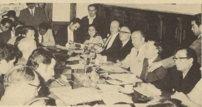
LA COMISION POLITICA del Partido Comunista encabezada por el Secretario General Luis Corvalán, emitió ayer sus puntos de vista acerca del estado de la Unidad Popular.

De las declaraciones de Corvalán (formalmente unitarias al afirmar que buscará el entendimiento por todos los medios) se desprende sin embargo que el principal perjudicado es el candidato Rafael Tarud, a quien se está vetando, a pesar de que se afirma "que si el acuerdo se produce en torno a él, el PC lo respetará".