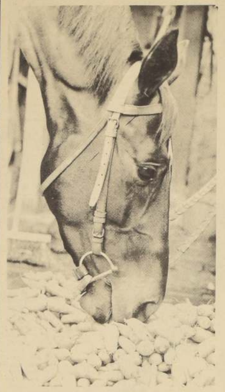
GRAN KAN, trabajo el sábado en Viña "Pa'callado". Se ve muy bien.

ALMA DE ACERO (P. Ubiña) 1.600 en 1' 41" 2/5. Últimos 200 en 12" 3/5. SISAL (G. Meneses) una vuelta 2.090 en 2' 12" 2/5. Últimos 200 en 12" 3/5. HUINCHÉ (C. Pezoa) 1.600 metros en 1' 51" al carrerón. DESTINO (E. Guajardo) 1.400 en 1' 27" 2/5. Últimos 200 en 12" 2/5. EXOTICO (J. Salinas) 1.600 en 1' 40" 1/5. Últimos 200 en 11" 4/5.