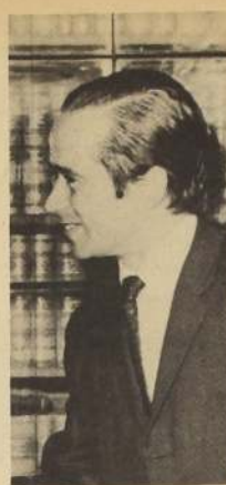
ZALDIVAR: la inflación no se puede ocultar.

Al artículo 35 de la Ley de Presupuestos se refirió luego el Ministro Zaldívar y dijo que en ella se consideran tres rubros de artículos que podrán tener alzas superiores a un 28% y que son materias importadas como el azúcar y el café, las empresas de utilidad pública y artículos afectados por impuestos indirectos como el combustible.