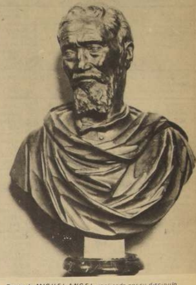
Busto de MIGUEL ANGEL, realizado por su discípulo.

Lo que se suele dudar por seguir es que Miguel Angel pintó más de una vez la escena de la Crucifixión, en obras que en su tiempo fueron muy admiradas. Al respecto se ha discutido mucho en materias de atribuciones y de autenticidad, también porque se tiene conocimiento de que las copias han sido numerosas. En todo caso, parece comprobado — también sobre la base de escritos autógrafos — que dos de estos Crucifijos fueron donados por el artista a Vittoria Colonna, la insigne poeta y poetisa (1490-1547), que al enviárselos, entró en un convento y llegó a ser superiora de varios, pero permaneciendo siempre ligada a Miguel Angel por una profunda afinidad espiritual, religiosa y artística.