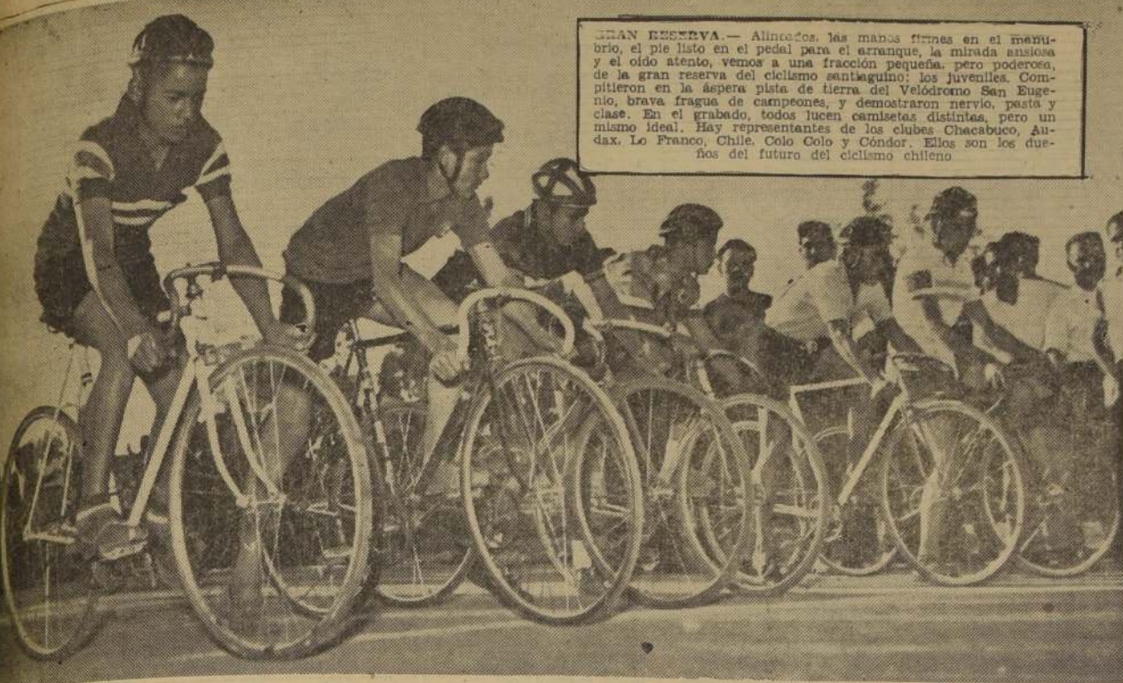
GRAN RESERVA. — Alincados, las manos firmes en el manubrio, el pie listo en el pedal para el arranque, la mirada atenta y el oído atento, vemos a una fracción pequeña, pero poderosa, de la gran reserva del ciclismo santiaguino: los juveniles. Compitieron en la asfáltica pista de tierra del Velódromo San Eugenio, brava fragua de campeones, y demostraron nervio, pasta y clase. En el grabado, todos lucen camisetas distintas, pero un mismo ideal. Hay representantes de los clubes Chacabuco, Audax, Lo Franco, Chile, Colo Colo y Condor. Ellos son los dueños del futuro del ciclismo chileno.