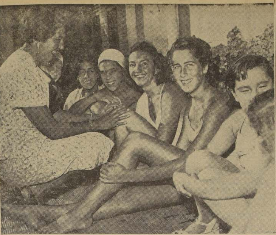
En la piscina de Los Leones el record de Chile en los 100 metros pecho, mariposa, con 1' 32" 6/10. Ambas sonríen, segurísimas del éxito. Mientras el resto también hace lo mismo