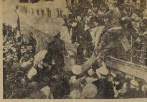
REGRESA UN VETERANO.— BARCELONA, 6.— (Radiofototelevisión).— Amigos ayudan a bajar a un inválido veterano que combatió en la División Azul contra los rusos, quien vuelve a su patria después de 8 años de cautiverio en la URSS. Con él volvieron 285 prisioneros.

Indochina, 6.— (UP).— Las autoridades francesas informaron que una nueva formación de 25 bombarderos B-26 llegó a las bases del delta del río Rojo el domingo, y que la mayoría de los restantes han llegado ya desde entonces. Los aviones serán lanzados a la batalla de Dien Bien Phu tan pronto como las tripulaciones estén listas y se les permita a la necesaria revisión. Indochina, 6.— (UP).— Los aviones norteamericanos que se lanzaron a la batalla de Dien Bien Phu, desde entonces, los aviones serán lanzados a la batalla de Dien Bien Phu tan pronto como las tripulaciones estén listas y se les permita a la necesaria revisión.