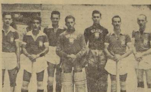
CUADRO DE HOCKEY DE BRASIL. — Conjunto de hockey de Brasil, que el sábado enfrentará a la selección nacional en el Estadio Chile, en un encuentro que seguramente alcanzará contornos interesantes, por la calidad de juego de los protagonistas, que son, indudablemente, los mejores de Sudamérica.

Con ropero tres cuerpos, desarmable. 657 NATANIEL 657 NO TENEMOS SUCURSAL