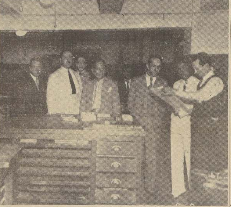
Los turistas peruanos visitaron nuestro diario.