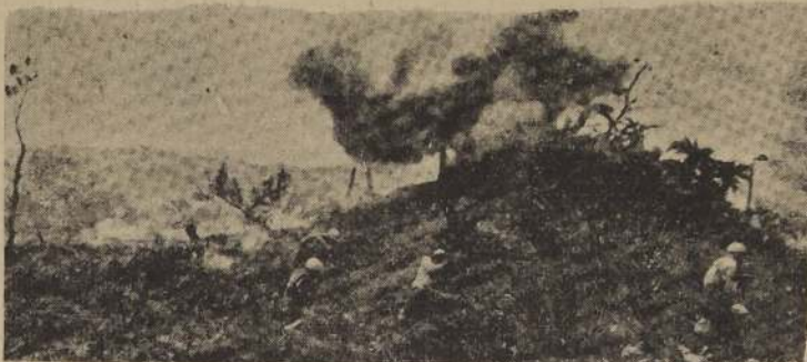
A pesar de la enconada y fanática resistencia nipona, la Infantería de Marina aprieta inexorablemente el cerco de los últimos defensores de Okinawa, y asalta, vuela o incendia uno por uno los reducidos, escondrijos y bastiones de que está sembrada la isla, donde cada colina ha sido transformada en una fortaleza.

oleas con baños exclusivos. Cafetería permanente. Lunch a toda hora. Abierto día y noche. Entradas. SAN PABLO 1405 Y