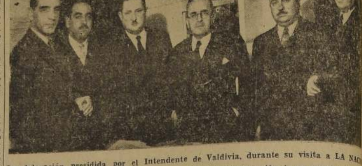
La delegación presidida por el Intendente de Valdivia, durante su visita a LA NACION

LA DELEGACION DE LA CIUDAD AUSTRAL VISITO AYER "LA NACION"