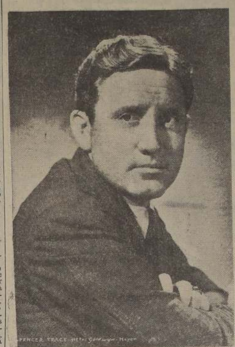
El actor de cine Spencer Tracy que, por inconvenientes de última hora siente no poder asistir a nuestro IV Centenario