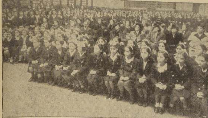
Un aspecto del alumnado del Liceo reunido el día de ayer.