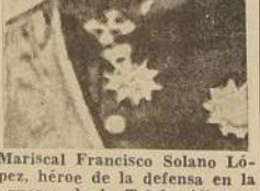
Mariscal Francisco Solano López, héroe de la defensa en la guerra de la Triple Alianza.