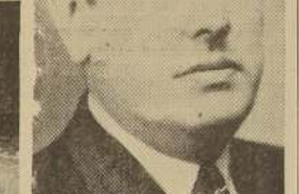
General Estigarribia, ex Presidente de la República, héroe del Chaco.