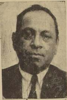
ha citado para hoy a las 11 horas, en las puertas de LA NACION, a fin de concurrir al sepelio.