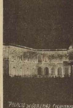
Palacio de Gobierno (Iluminado) en Asunción, Paraguay.

La "igualdad de los hombres", a sus "derechos imprescriptibles" a la facultad del pueblo para darse su propio Gobierno, etc. En Córdoba fue condisculpa de Juan Manuel Gorrari, de Juan José Paso, etc. No fue un improvisado. Fue el gobernante más preparado de su época. Por eso dirigió la revolución paraguaya. "No fue un aventurero, ni un co-rumpido ni un resentido social". De lastró lineal—como que descendía de Yegros y Ledesma, ex Gobernador y Capitán General de la Provincia—ponía, sin afectación, un tinte de aristocracia en todos los actos de su vida. Fue el héroe de la Triple Alianza, un soldado de la revolución, un soldado de la patria, un soldado de la civilización. Su dictadura, que se pro-