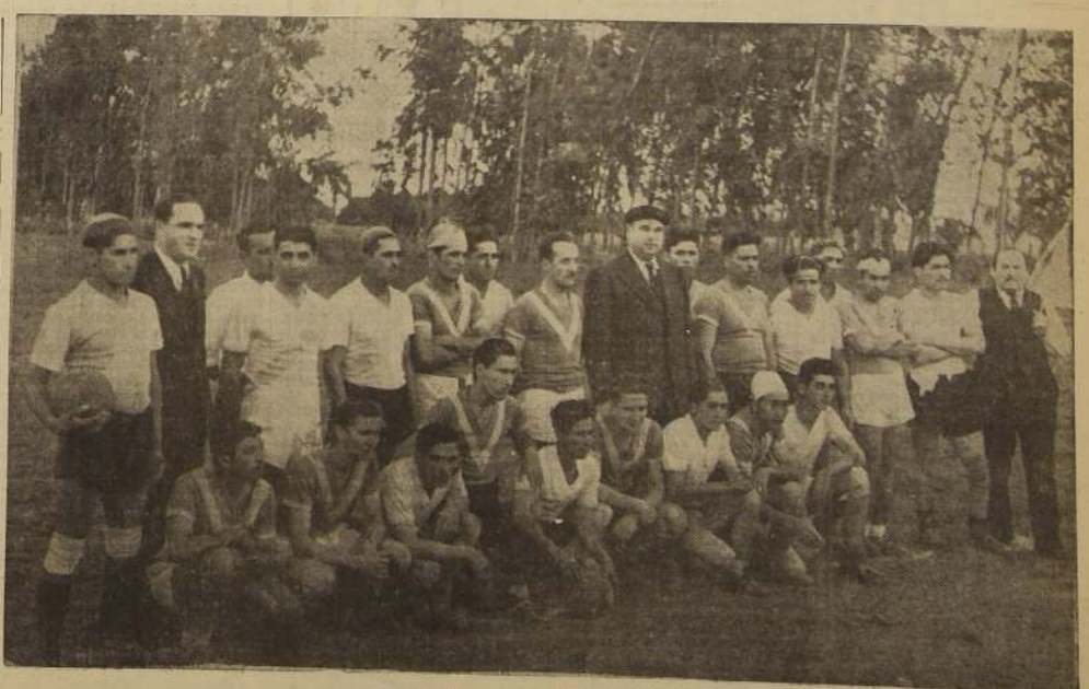
Participantes en las pruebas deportivas