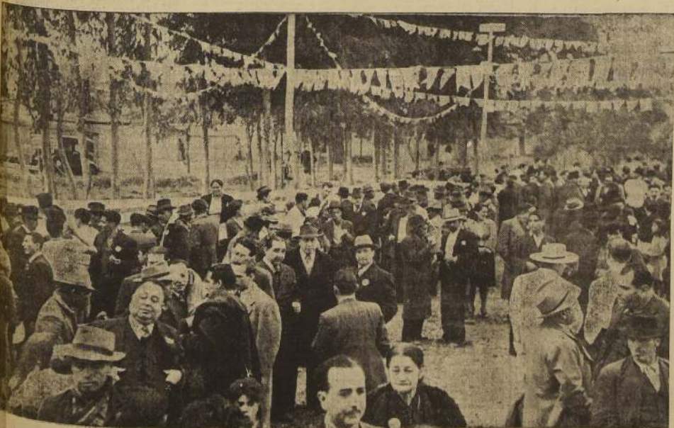
Aspecto general de la concurrencia.

Fue objeto de los más elogiosos comentarios la organización de esta fiesta, realizada con el objeto de proporcionar un día de solaz y alegría a obreros y empleados de la Viña, dentro de un ambiente sano y de sincera confraternidad espiritual.