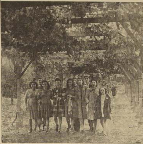
Un simpático grupo bajo las parras

Todos los números de la Fiesta de la Vendimia constituyeron el más brillante de los éxitos y fueron una demostración del trabajo y entusiasmo de sus organizadores. La atención de los asistentes fue tan cordial y