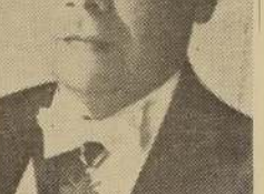
Excmo. señor Hilgino Morinigo, Presidente de la República del Paraguay.