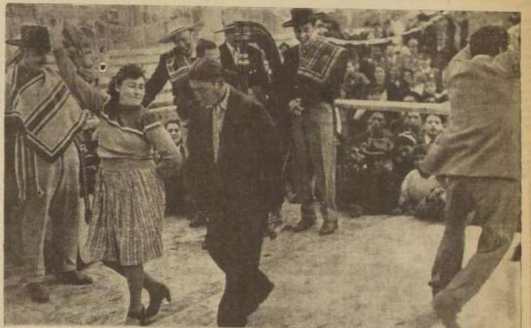
Un concurso de bailes nacionales durante la fiesta

Después de todos los números a que hicimos referen-