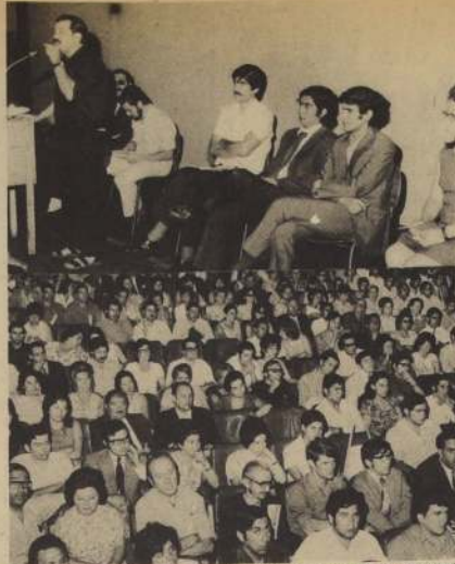
EN EL TEATRO ROMA se reúnen funcionarios de los diferentes servicios afectados por la reducción de presupuesto, así como representantes de las Juntas de Vecinos, Centros de Madres Sindicalistas, Unico de Estudiantes, grupo funcional de CORFO, DIRINCO y Trabajadores de la Educación. Los oradores condenaron la actitud congresista que los deja sin su trabajo.

INSCRIPCIONES E INFORMACIONES: A partir de esta fecha en la Oficina Central de Informaciones, CASA CENTRAL UTE, Avenida Ecuador N° 3469. Fonos 93386 y 97401, anexo 224, de 9.30 a 20 horas, de lunes a viernes.