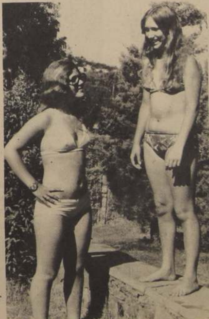
Estas chicas se desprecupan de la política y le hacen quites al calor en una piscina de

En cuanto a la exportación a Cuba, hizo presente que el tipo de frijol adquirido por esa nación caribeña, el red-kidney no tiene consumo en el país, a pesar de que es muy solicitado por otras naciones, incluso europeas. Este poroto sólo se siembra en las provincias de O'Higgins y Ruble, donde existen suelos aptos y condiciones de exportación.