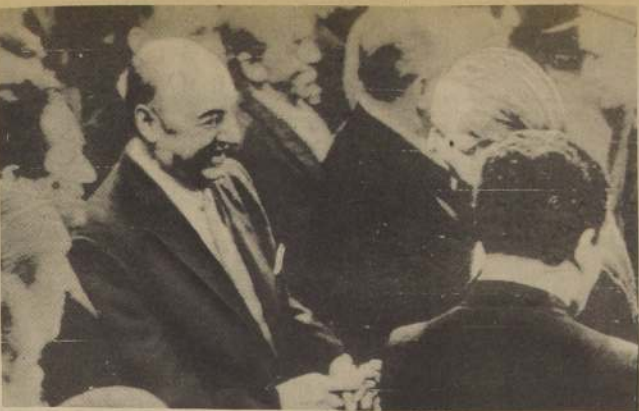
EN UNA RECEPCION diplomática en el Palacio Elysee, el Presidente francés Georges Pompidou saludó y congratuló al poeta Pablo Neruda a la izquierda, Embajador de Chile en Francia, ganador del Premio Nobel de Literatura de 1971