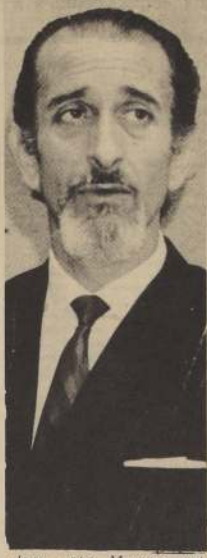
José Tohá Ministro del Interior