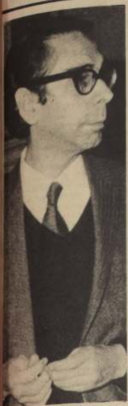
Carlos Altamirano Secretario General del Partido Socialista