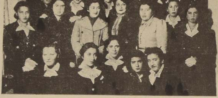
Delegación de profesores y alumnas del Liceo de Niñas de Rancagua, que visitaron LA NACION.