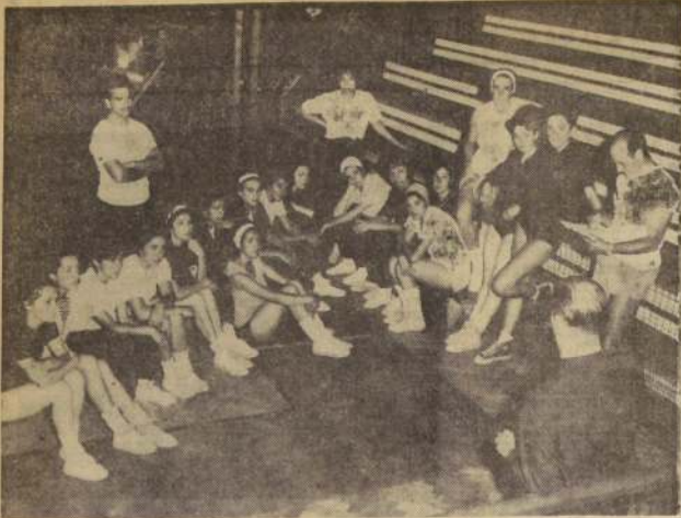
VIAJARAN A PERU. — El plantel chileno de basquetbol femenino actuará en marzo en Arica y Tacna. Estas serán las primeras actuaciones en público del equipo nacional que participará próximamente en el Torneo

El representante nacional jugará cuatro encuentros, dos en Arica y dos en Perú, en la semana comprendida entre el 10 y 16 de marzo. — Finalizó con gran éxito Curso de Entrenadores en Concepción. — Se modificó la organización de los Torneos en Valparaíso.