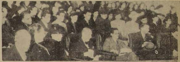
Personalidades y parte del público asistente a la velada en homenaje a Panamá

En la tarde de ayer se efectuó en la Escuela de Niñas "República de Panamá", Anexa a la Normal N.º 1, un acto literario-musical en homenaje al aniversario de la Independencia de la República de Panamá.