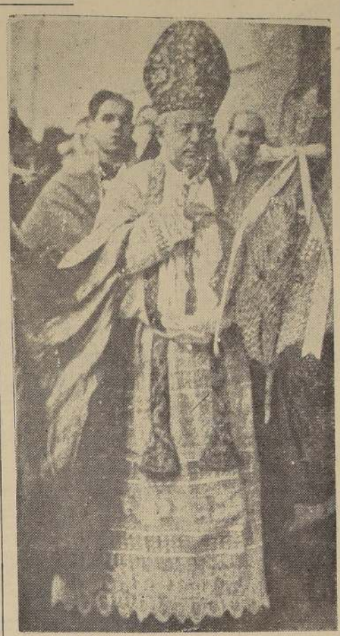
El Legado Pontificio, Cardenal Monseñor Santiago Luis Copello

Se notará informado, también, que estas transmisiones se realizarán en cadenas con otras emisoras, entre las cuales se encuentran "La Americana", algunas estaciones del sur y norte del país; asimismo, sabemos que una importante emisora de Buenos Aires transmitirá en cadena con C. B. 126.