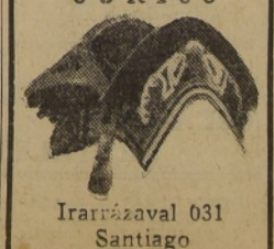
Irarrázaval 031 Santiago