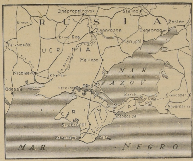
Mapa de Crimea, donde la situación para los rusos parece ser bastante difícil, los que, según las informaciones procedentes de Berlín, están evacuando la península.