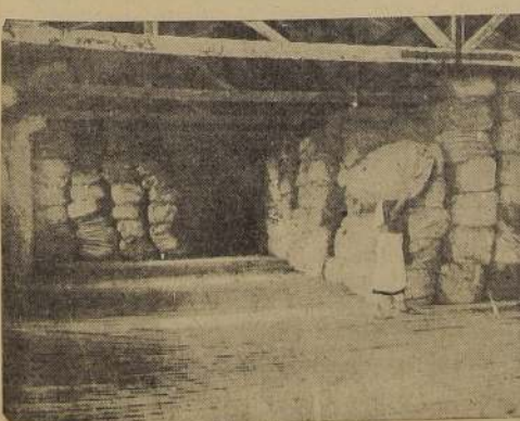
Un rincón del segundo piso de la bodega de tabacos

Hemos querido — nos agrega reafirmando su fundado optimismo en el buen éxito de la empresa que lo ha contado como uno de sus principales iniciadores y propulsores —, dotar al país de una industria netamente chilena, que evite la salida de capitales al exterior por el concepto de utilidades, y que sea, al propio tiempo, una fuente vital de recursos para la nación.