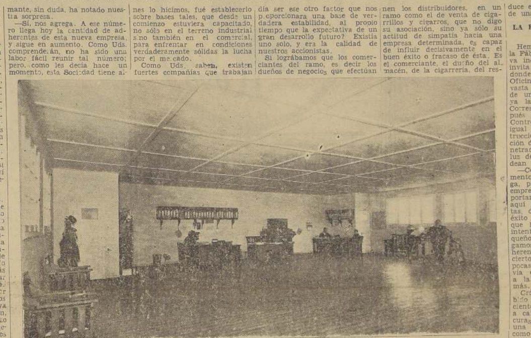
Vista de las oficinas de la Fábrica, donde funcionan actualmente la Gerencia y Contaduría, y se instalarán las Secciones de Venta, Propaganda, Distribución, etc.