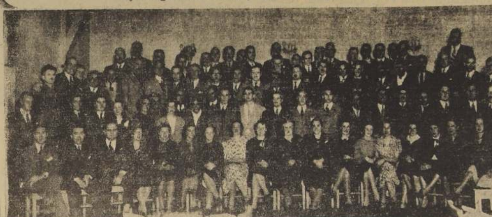
Los deportistas argentinos y uruguayos y dirigentes y aficionados chilenos, durante la manifestación en el Stade Français

Ayer regresaron atletas y nadadores argentinos, uruguayos y brasileños