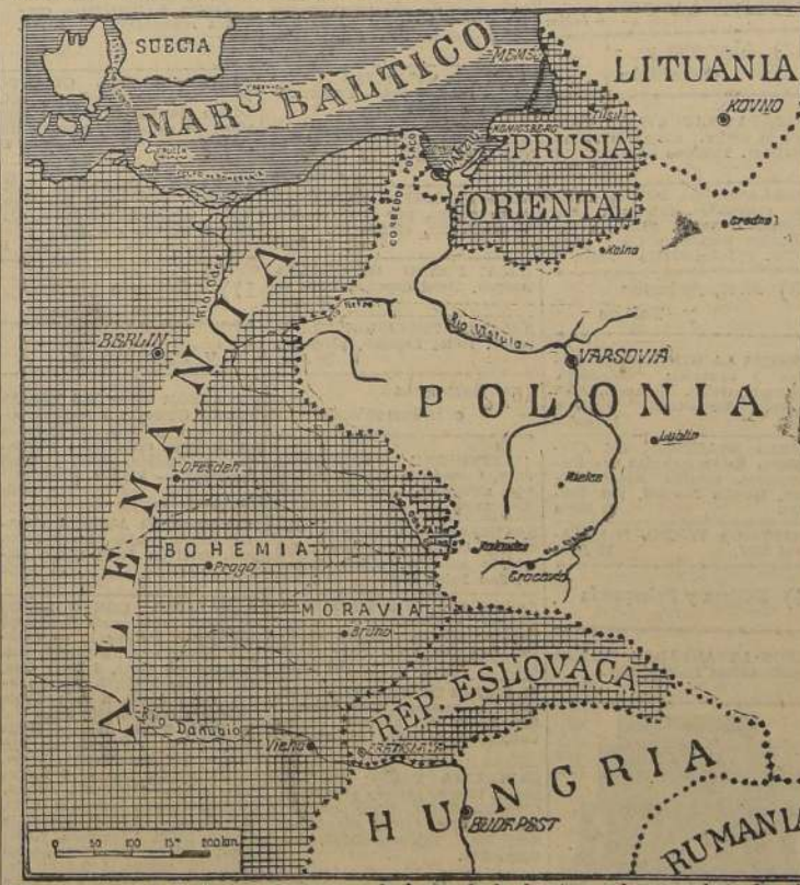
La concentración de tropas alemanas a lo largo de la frontera eslovaco-polaca, ha sido interpretada como una maniobra del Reich para cercar a su poderosa vecina de Europa oriental.

Las autoridades japonesas de Tien-tsin rechazaron todas las sugerencias para una solución conciliatoria del bloqueo