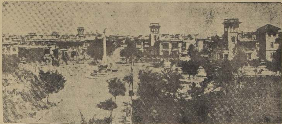
Un aspecto del barrio de las concesiones extranjeras en Tien-tsin