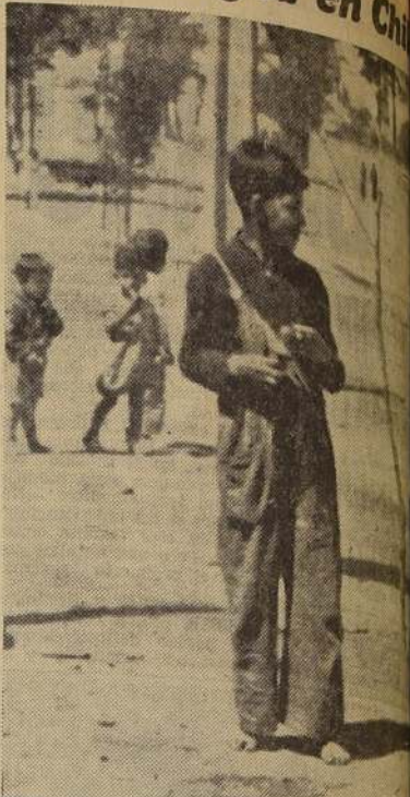
TAREA CIUDADANA. — Más de tres mil niños vagos piden limosna, otros se entregan a la rapacidad, al betismo, promiscuidad y delincuencia. El país necesita de estos niños. Al Gobierno un futuro mejor para terminar con la vagancia infantil, para su realización, clindible la cooperación de todos los hombres que trabajan por la prosperidad de nuestra patria.