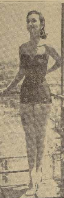
SONRÍE A LA VIDA. — Apoyada en una de las barandas de la terraza del Hotel Carrera, la espijada representante de Curicó recibe el cálido contacto de los rayos solares y parece sonreír a la vida, con todo el optimismo y las esperanzas que alienta la juventud.

Su ascendencia italiano-francesa ha despertado en ella el gusto por la música y la pintura. En la quietud de la noche, cuando expiran, derrama su melancolía en suaves notas que arrancan al piano de su casa. En pintura admira los paisajes y estima que la geografía de Chile cuenta con las más sobradas condiciones para