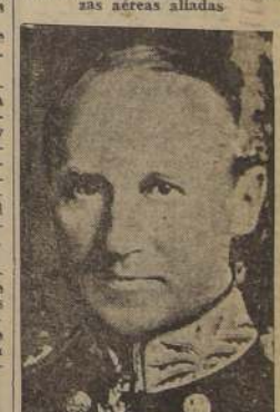
ALMIRANTE SIR BERNARD HOME RAMSAY, comandante en jefe de las fuerzas navales