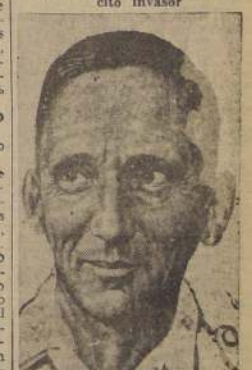
SIR ARTHUR TEDDER, vice-comandante en jefe de las fuerzas aéreas aliadas