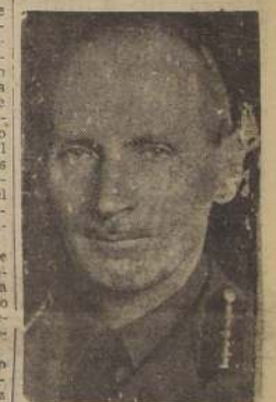
SIR BERNARD MONTGOMERY, al mando directo del ejército invasor

La Radio agregó que algunos prisioneros tenían instrucciones para ser puestos en práctica en el caso de los descensos de tropas paracaídas.