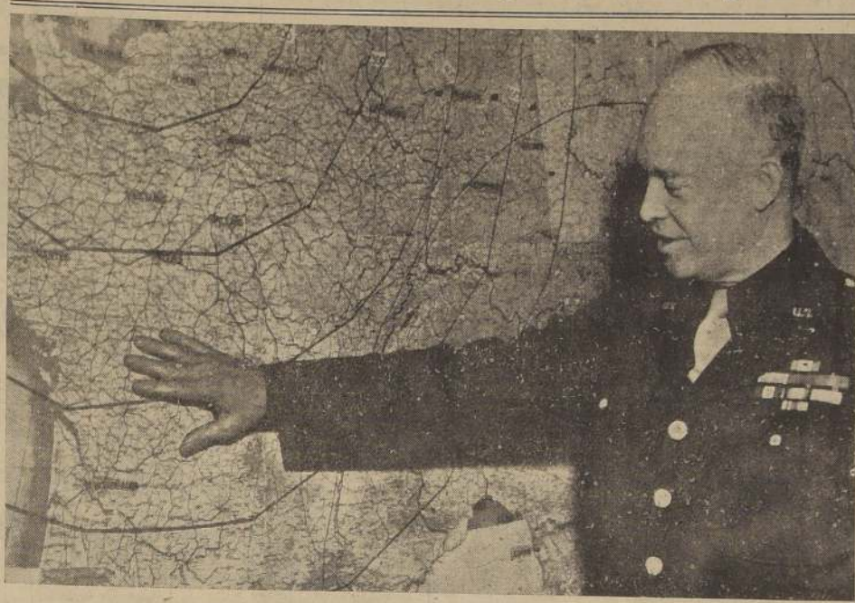
Eisenhower estudia sobre el mapa de Francia la estrategia de la invasión

Los pilotos de cazas Mustang que volaron sobre las cabezas de playa informaron en la madrugada que las tropas de infantería se espaciaron por las playas alrededor de las 7 A. M. al parecer sin intensa oposición, mientras que las grandes formaciones de buques de guerra castigaban implacablemente con sus cañones las defensas del enemigo. Además que cientos de aviones cruzaban y recubrían el Canal, mientras que por debajo de ellos enormes