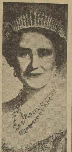
S. M. la Reina Isabel de Inglaterra

LONDRES 10. — (U. P.). — El Palacio de Buckingham anunció que S. M. la Reina, dirigirá un mensaje por radio a las mujeres del Imperio, el domingo a las 9, hora de Greenwich. Será ésta la novena vez que la Reina Elizabeth se dirigirá por radio desde que subió al trono, y la quinta durante la guerra.