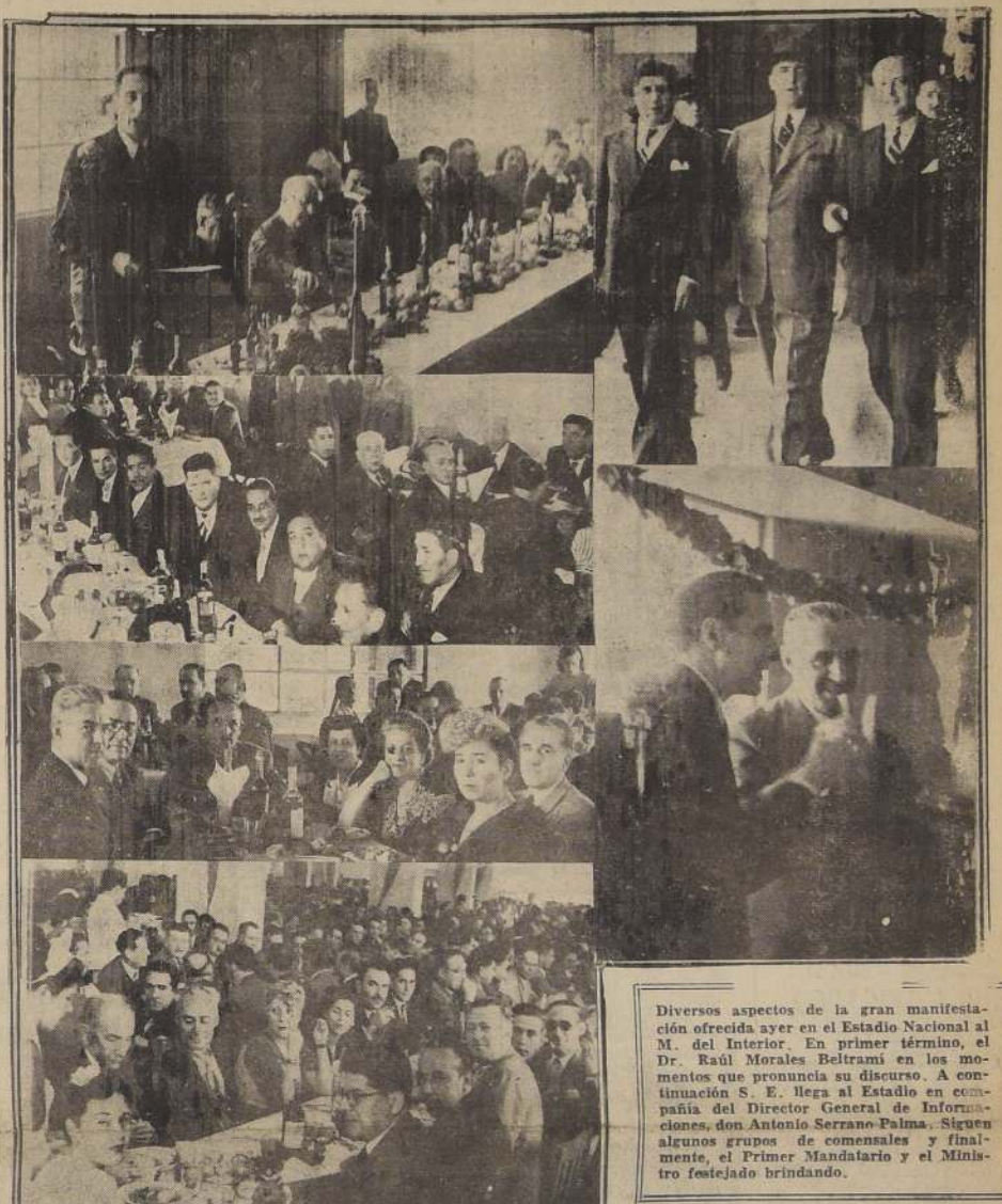
Diversos aspectos de la gran manifestación ofrecida ayer en el Estadio Nacional al Dr. Raúl Morales Beltrami en los momentos que pronuncia su discurso. A continuación S. E. llega al Estadio en compañía del Director General de Informaciones, don Antonio Serrano Palma. Siguen algunos grupos de comensales y finalmente, el Primer Mandatario y el Ministro festejado brindando.