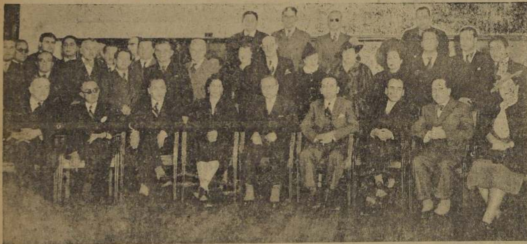
Asistentes a la manifestación ofrecida al Ministro de Educación