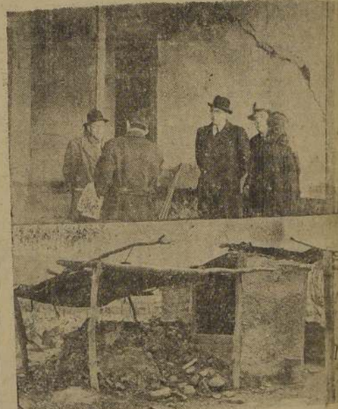
La comisión durante su visita a Til-Til. Arriba: la muralla de un edificio seriamente dañado por el temblor del lunes. Abajo: uno de los ranchos con sus murallones en el suelo

El sábado se efectuará el almuerzo que anualmente se celebra a las familias antofagastinas como una manera de celebrar el aniversario de la 3.ª Compañía de Bomberos de Antofagasta.