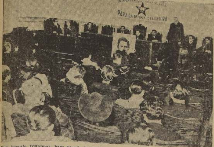
Don Augusto D'Halmar, hace uso de la palabra durante la velada de ayer en la Universidad de Chile, organizada por la Alianza de Intelectuales en homenaje a Baldomero Lillo