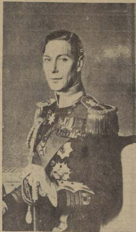
S. M. JORGE VI

BUCAREST, 21 (U. P.). — Se ha concedido una semiautonomía a la minoría alemana en Rumania por medio de un decreto que declara que "el grupo étnico alemán en Rumania tendrá el derecho de tomar decisiones que serán obligatorias para todos sus miembros".