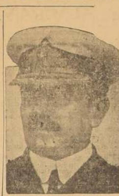
Almirante don Hipólito Marchant, nuevo Ministro de Marina.