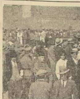
Parte de la numerosa concurrencia que presenciaba ayer a las 9 de la mañana las excavaciones

de la boca, el túnel se hace un poco más hondo, de manera que una persona puede ya caminar de rodillas, como él lo hizo en vista de estas facilidades que encontraron, en las profundidades del hueco misterioso.