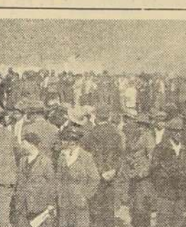
Entrada al túnel secreto que fué descubierto ayer. Conduce a la entrada de la gran bóveda en cuyo interior existirían los cofres con el fabuloso tesoro.

de la boca, el túnel se hace un poco más hondo, de manera que una persona puede ya caminar de rodillas, como él lo hizo en vista de estas facilidades que encontraron, en las profundidades del hueco misterioso.