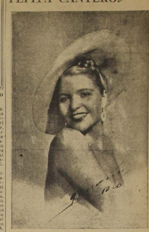
la graciosa vedette y cancionista, intérprete de la canción carioca, que debutó esta noche en los programas de la Radio "EL REGIO", con los últimos éxitos del Carnaval de Rio de Janeiro