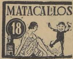
(A base de coledón y ácido láctico). Es un gran extirpador de callos y callosidades. M. R.

"Entre a la vida con la orden de salir de ella, y vengo a representar mi personaje; vengo a mostrarle como los demás; después, es preciso desaparecer. Voy a pasar delante de mí a otros; otros me verán pasar a mí y éstos darán a sus sucesores el mismo espectáculo". —Bosquet.