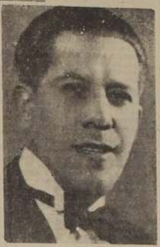
"JUGANDO MAMA, JUGANDO"