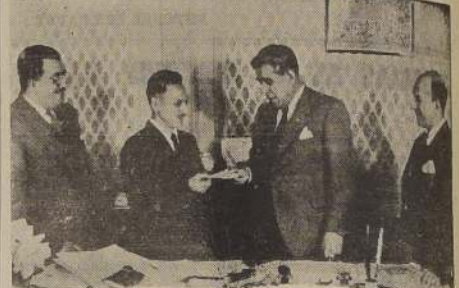
Durante la entrega del premio

EL ACTO SE LLEVO A EFECTO EN LA DIRECCION GENERAL DE INFORMACIONES