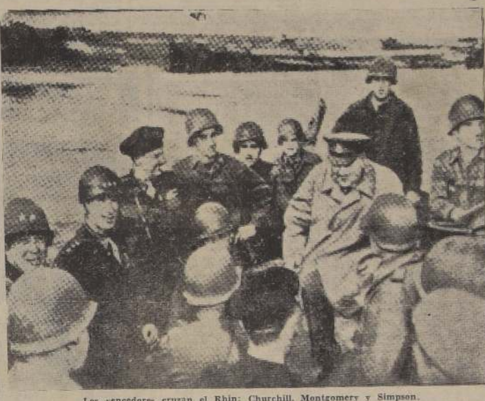
Los vencedores cruzan el Rin: Churchill, Montgomery y Simpson.

SAN FRANCISCO, 6 (U. P.).—Japón está plenamente preparado para cualquier "cambio brusco" que pueda resultar de la denuncia del pacto.