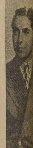
Tyrone Power, uno de los actores que más se ha destacado en Hollywood en la temporada de 1938.