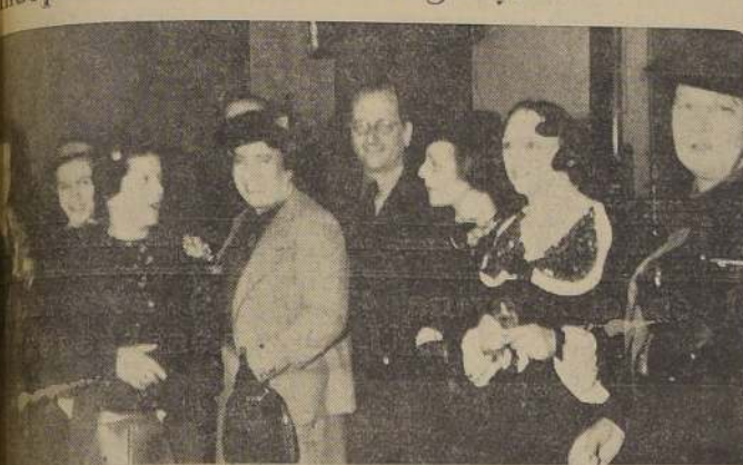
Excmo. señor de Uruguay rodeado de algunos de sus miembros de la colonia que concurren a la recepción.

La expresión del sentimiento de fraternidad y solidaridad que para con la república del Uruguay, se efectuó una serie de festividades culturales y deportivas en conmemoración del 128.º aniversario de su independencia. El Excmo. Sr. Carlos de Santiago, agradeció la atención del Gobierno y de su Ministro.