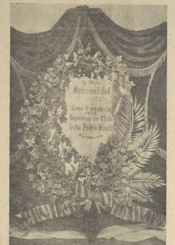
Corona de flores a la Ilustre Municipalidad de Santiago dedica a la memoria del Excmo. Sr. Don Pedro Montt.