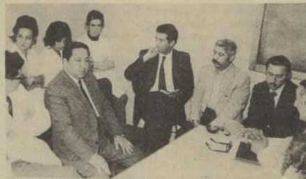
UNA VISITA al Centro de Rehabilitación Oral del Hospital Barros Luco realizaron en la mañana de ayer los Ministros, Luis Figueroa, de Trabajo, y Arturo Jirón, de Salud. Según se informó, la reunión que ambos Secretarios de Estado sostuvieron con personal de dicho establecimiento, tuvo por objetivo impulsar el funcionamiento del Centro de Rehabilitación Oral, que atiende a un amplio sector de la población de San Miguel. Quedó en claro la necesidad de contar con nuevos elementos y materiales necesarios para el regular funcionamiento del establecimiento. En el grabado, un aspecto de esta reunión.

Son necesarias, dijo Figueroa, algunas modificaciones a la actual organización, para que los trabajadores no pierdan el día completo de trabajo cuando deben recibir atención médica. Una de las soluciones podría ser