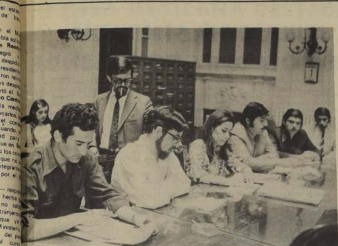
Los dirigentes juveniles de la Unidad Popular, durante la reunión de la Juventud democrática cristiana se ha sumado a la estrategia derechista para impedir que las elecciones de marzo sean democráticas y libres.