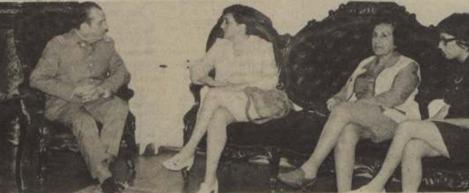
Un aspecto de la reunión que sostuvieron representantes del Frente Patriótico de Mujeres con el Vicepresidente de la República, General Carlos Prats.

Las mujeres también expresaron que el Vicepresidente de la República les había ofrecido todo su apoyo en las tareas que se han impuesto, ya que el aporte de la mujer era importante para todo lo que significó progreso y desarrollo.