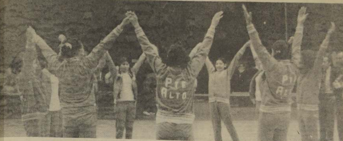
EL ELENCO de Puente Alto, pese a su derrota ante Curicó, se transformó en un serio rival, y en el único puentealtino que pueden mantener el título.