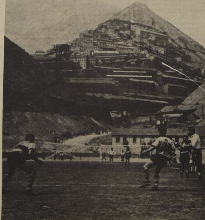
EL TENIENTE será el imponente escenario de los Primeros Juegos Deportivos del Cobre.

Mañana domingo prosigue el torneo con los 167 kilómetros individuales que partirán del Estadio Luis Valenzuela, para continuar por la Panamericana Norte y regresar al punto de largada.