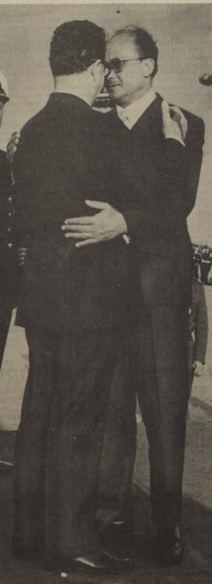
Los Presidentes de Chile y México se estrechan en un fuerte abrazo. Es la unión de dos pueblos hermanos.

En la sede de la Embajada chilena, ambos Mandatarios sostuvieron una conversación informal y se presentaron algunos funcionarios de confianza que acompañan al Presidente Allende en su gira.