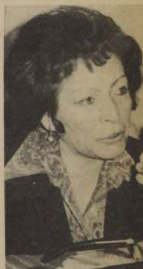
FRESIA URRUTIA, Directora General de Educación Básica. "El deporte es muy importante para los trabajadores de la educación".

En la jornada de apertura del campeonato de fútbol de los trabajadores de la Educación, se disputará un solo encuentro, cuyos protagonistas no han sido aún dados a conocer. A las 10 de la mañana comenzará el desfile de las delegaciones en el campo deportivo de la UTE, cuyos integrantes saludarán a las autoridades que han hecho posible este encuentro deportivo de los trabajadores de la educación de todo el país. Fresia Urrutia, quien gestó la autorización para la realización del campeonato futbolístico, iniciando los correspondientes telegramas a provincia para comunicar que en Santiago todo estaba listo para el tomen.