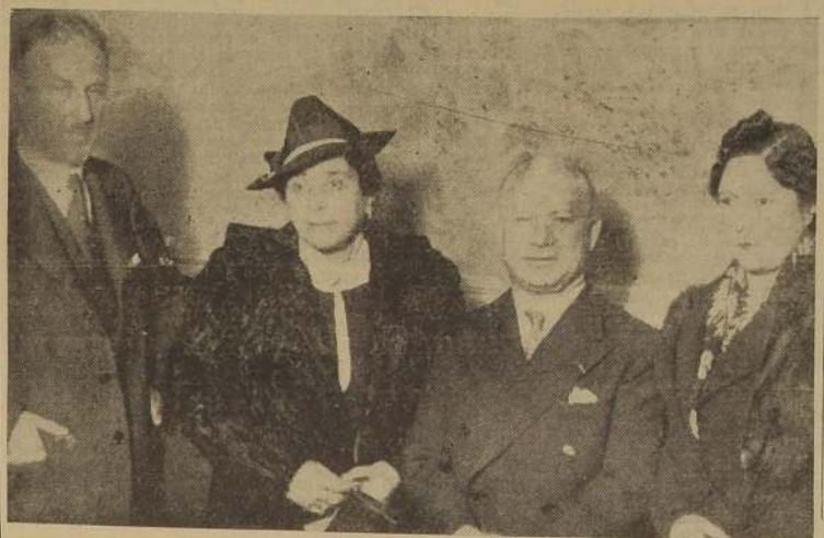
La señora Juana Aguirre de Aguirre Cerda y Mischa Elman, durante el cocktail en el Consejo Nacional de Mujeres.

El Consejo Nacional de Mujeres ofreció ayer, en el local de la Institución un cocktail al eminente artista Mischa Elman, al cual asistió gran número de socias y sus familias, como también distinguidas personalidades de nuestro mundo social.