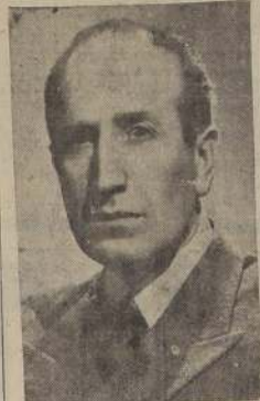
El Canciller D. Joaquín Fernández