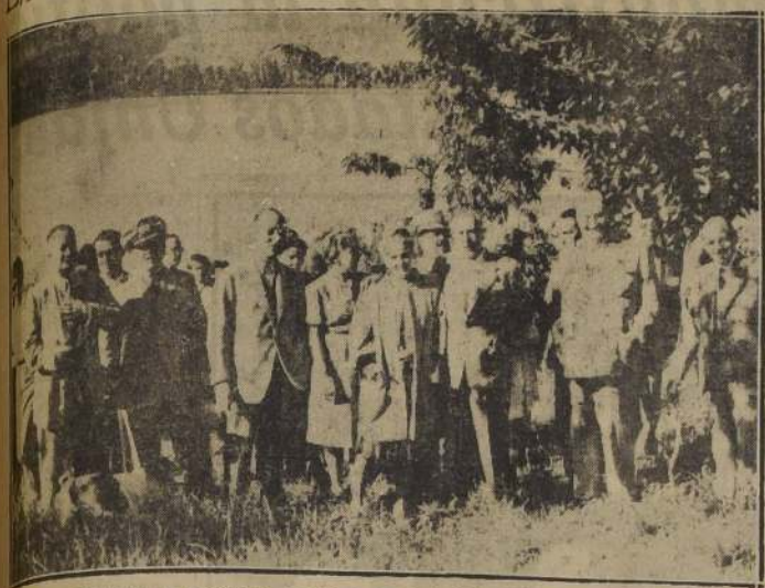
El Presidente de la República, y señora de González Videla, y huéspedes del Gran Hotel Termas de Puyehue, durante una visita a la isla Fresia.