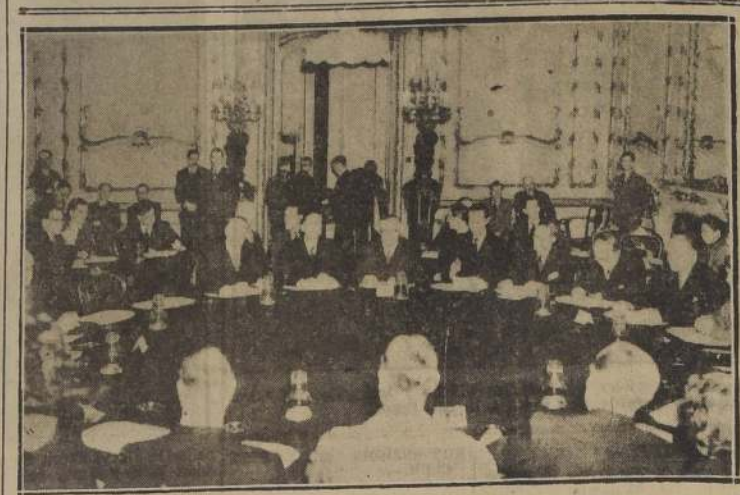
LONDRES. — Vista general de la reunión inaugural de los delegados de los Ministros de Relaciones Exteriores británicos Mr. Ernest Bevin, en compañía de M. Gusev, delegado del Ministro de Relaciones Exteriores soviético, a la extrema derecha.