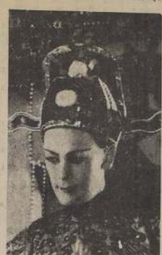
El Ilustre Eliseo Grenet, que hoy debuta en el Teatro Santa Lucía, con su compañía de revistas mágicas

Hablar de Eliseo Grenet, es despertar la atención de los lectores, ya que muchos de ellos han seguido la trayectoria de su triunfante carrera. Luego de haber escrito numerosas obras para el teatro, y viendo que sus canciones como compositor eran pocas para él, dio forma a la idea de organizar su propia orquesta, en la que pu- liza volcar su amplia inspiración. Con ella recorrió, España, Francia, Inglaterra, Estados Unidos, Centro y Sud América, alcanzando en cada uno de los países, no sólo el aplauso popular, sino el de los altos personajes que seguían con interés, los distintos motivos, que cada uno de los instrumentos de su orquesta, como, el bongó, la conga, el repi- cador, la maraca, sartenes y cila- ves abundaban los rítmicos sonos de las canciones afro-cubanas. Ya en ese tren, Eliseo Grenet, compuso, piezas que concurrieron con el más amplio favor de los auditores. Y si no, recordemos su famosa: "Ay, mamá tía!" "La Conga" y "Lamento esclavo", pa- ra no ser más extensos. Estudios San Miguel de Argentina, no dejó pasar por alto los antecedentes de este gran músico, y aprovechando su estadía en Buenos Aires, lo contrató para que actuara con su gran orquesta, en la película de Libertad Lamarque, "Romance Musical", y donde ella entona tres melodías de Grenet.