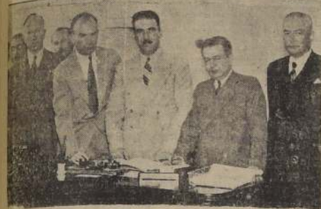
El doctor Etchebarne, Ministro de Salubridad, en el momento de la firma del convenio con la Fundación Rockefeller.

CONTRIBUIRA CON MAS DE 1.600.000 PESOS.— AYER SE FIRMO EL CONTRATO EN LA DIRECCION GENERAL DE SANIDAD