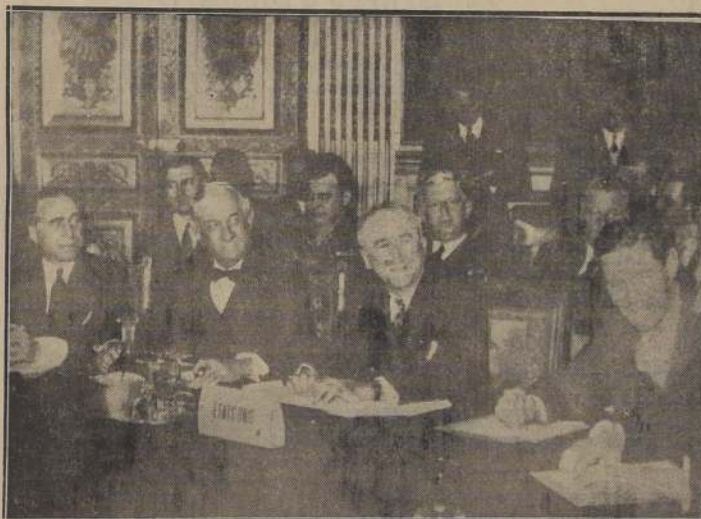
Aunque las cosas no van tan bien como se de sean, los delegados norteamericanos en la Conferencia de los Cancilleres muestran una cara sonriente al celebrar un chiste del señor Molotov, delegado ruso.

Algunos círculos sospechan que Molotov está intencionalmente postergando la consideración de los asuntos de la Dodecaneso, y de los valles de Tenda-Brillat, con el objeto de emplearlos como términos de transacción, cuando se pongan en discusión los asuntos importantes de la conferencia.