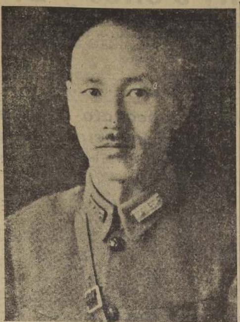
Generalissimo Chiang Kai-Shek

La provincia de Szechuan, que hace de cabeza en el bloque económico del Sudoeste, ha recibido la mejor atención de parte del Gobierno en su desarrollo industrial y económico. La futura prosperidad del interior está asegurada, después de una reciente conferencia entre el Ministro de los Asuntos Económicos, Dr. Won Wen-hui, y el Comisionado de Ho Pei-peng, Comisionado de