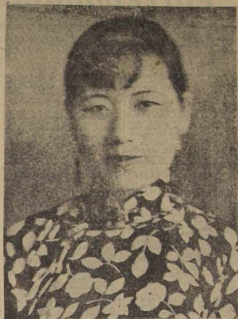
Madame Chiang Kai-Shek

Las artes mecánicas también están tomando un lugar preponderante en el desarrollo económico de Kweichow. La ola de industrialización