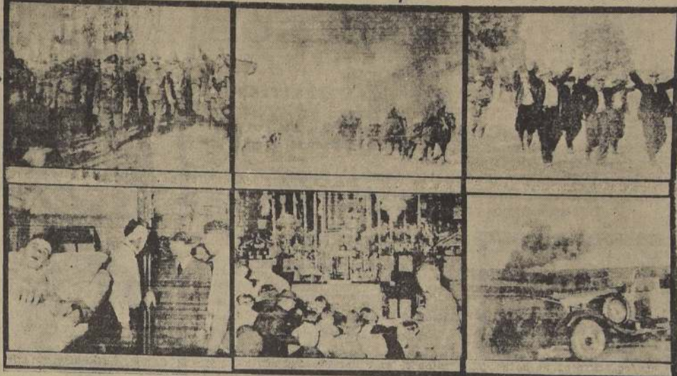
Arriba: izquierda, Hitler y sus generales pasan revista a las tropas. — Al centro, la artillería alemana avanza a todo trote a tomar posiciones. — A la derecha, civiles polacos tomados prisioneros por las fuerzas avanzadas alemanas. — Abajo: izquierda, el Führer visita un tren con heridos alemanes. — Al centro, fieles polacos orando en una iglesia. — A la derecha, explosión en un campo.