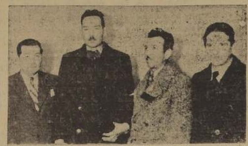
La delegación de vecinos de Yumbel que ayer visitó "LA NACION".

Delegación de vecinos expresa a "LA NACION" que el cambio de ubicación de la ciudad, beneficiaría a unos cuantos dueños de fundos y perjudicaría a cientos de pequeños propietarios