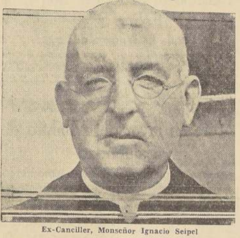
Ex-Canciller, Monseñor Ignazio Seipel

VIENA, 2.—A las 7 de la mañana y a la edad de cincuenta y seis años, falleció hoy el ex-canciller Monseñor Ignazio Seipel. Su salud estaba quebrantada desde hacía ocho meses. Por entonces se le trasladó desde una capital al Monasterio de Perntz. Monseñor Seipel sufrió de diabetes desde hacía largo tiempo. Su última actividad de importancia en la vida pública fue su jura en el otoño pasado a la presidencia de los funerales del ex-canciller monseñor Seipel, se hacen por cuenta del Estado.—(U. P.)