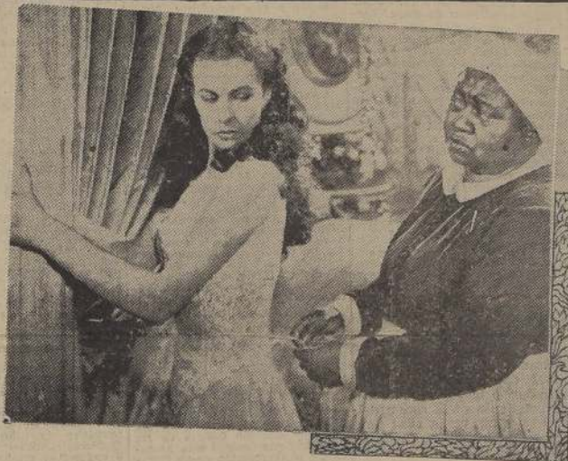
Vicién Leigh (Scarlett O'Hara) y Hattie McDaniel (Mama) en "LO QUE EL VIENTO SE LLEVÓ", producción de David O. Selznick, distribuida por Metro-Goldwyn-Mayer.