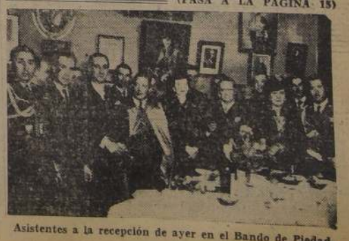
Asistentes a la recepción de ayer en el Bando de Piedad.