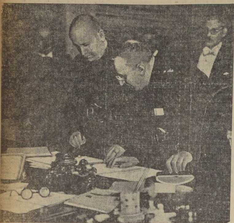
El señor Mussolini, en el momento de suscribir los protocolos por los cuales se constituye el bloque italo-austro-húngaro. Detrás del Duce se advierten los señores Goemboes y Schuchner.