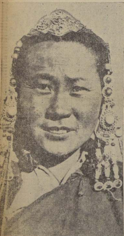
Belleza mongol, símbolo femenino de la tierra que se disputan rusos y japoneses, y que cada día amenaza ser el origen de una conflagración. Esta bella de los ojos oblicuos lleva veinte libras en oro en su cabeza.