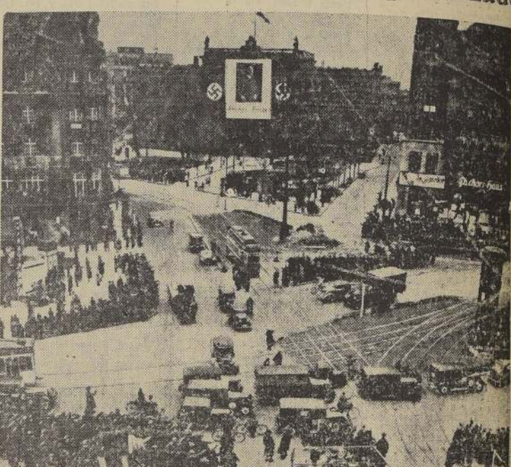
A las 16 horas del día 27 de marzo, poderosas sirenas resonaron en toda Alemania para anunciar que todo tránsito de vehículos debía ser suspendido durante un minuto, mientras Hitler dirigía una arenga relacionada con las elecciones. Aquí se ve la Plaza de Potsdam, en Berlín, en el momento en que están detenidos todos los vehículos, mientras la concurrencia hace el saludo nazi.

9 con 5.448 a 1.72, Chimbarongo, C. H. dest.