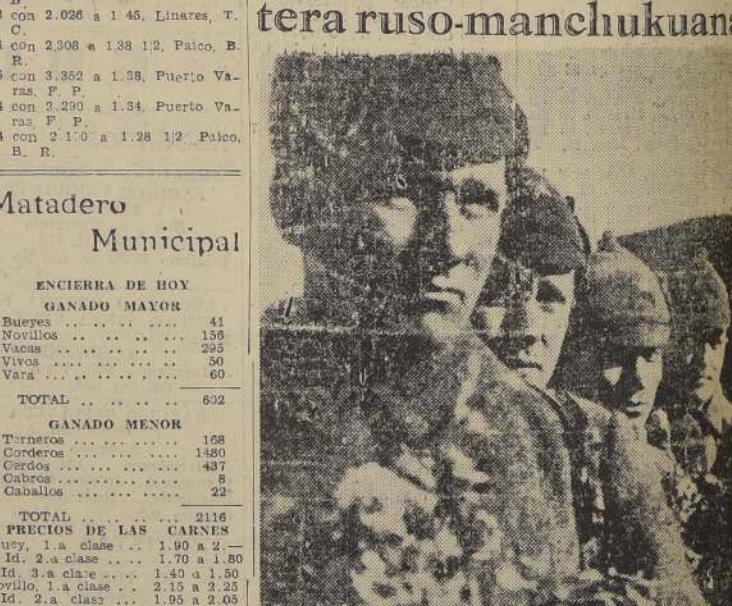
Estos soldados de la guardia soviética de fronteras han sido recibidos como héroes a su vuelta a Khabarovsk, después de haber sostenido un rudo encuentro con las tropas manchukuanas-japonesas en la región en disputa.

A las 16 horas del día 27 de marzo, poderosas sirenas resonaron en toda Alemania para anunciar que todo tránsito de vehículos debía ser suspendido durante un minuto, mientras Hitler dirigía una arenga relacionada con las elecciones. Aquí se ve la Plaza de Potsdam, en Berlín, en el momento en que están detenidos todos los vehículos, mientras la concurrencia hace el saludo nazi.