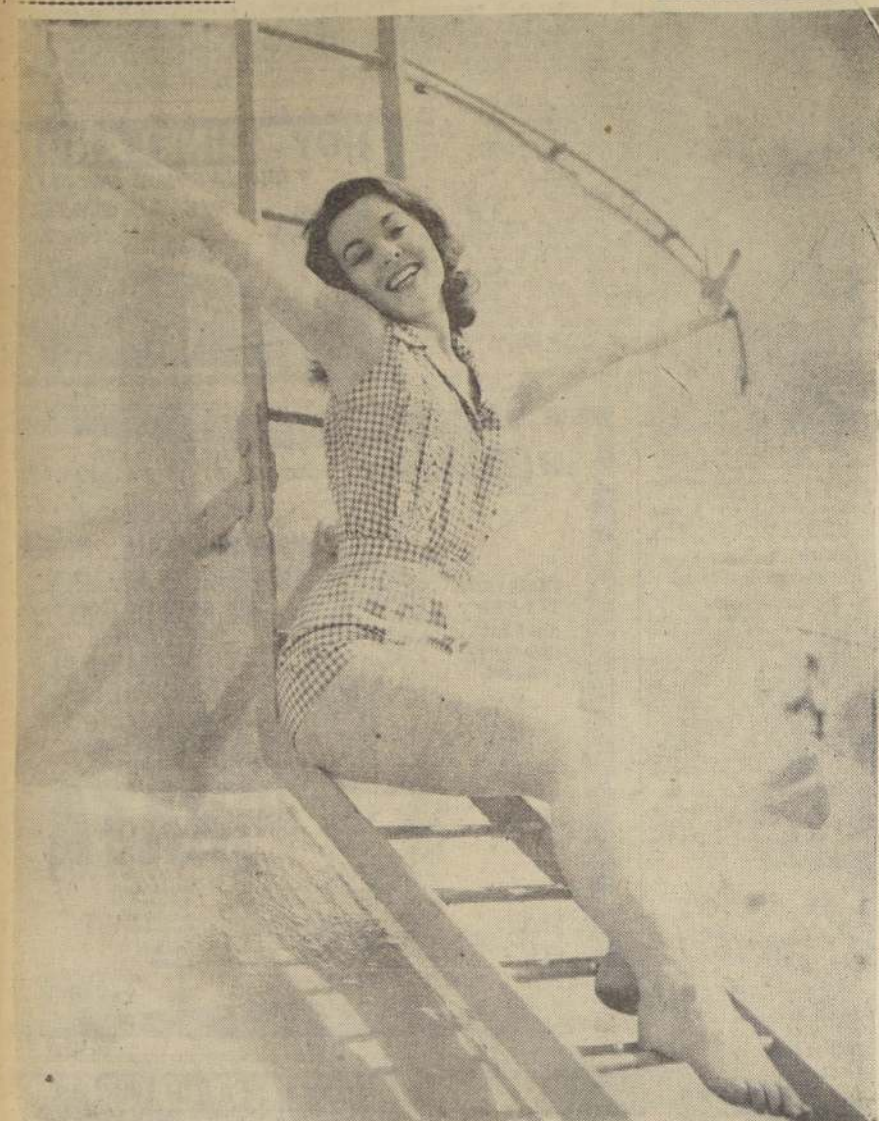
¿COMO AMANECIERON?— Como dormía bien durante sus vacaciones en el Mediterráneo, Anne Heywood solía levantarse temprano, pero en traje de baño, lista para lanzarse al agua. Y ahí la tenemos, dándonos los buenos días.