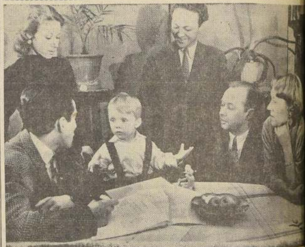
EN MOSCÚ.— Durante una semana, en toda Rusia se hizo un censo, calificado como el más completo hecho hasta la fecha en la URSS. Cerca de 600 mil funcionarios de todas las repúblicas soviéti-

cas, visitaron casa por casa, cerciorándose sobre cuántos vivían y trabajaban en cada una. En el grabado: un censo (quedará) visita e interroga a una familia de Moscú.