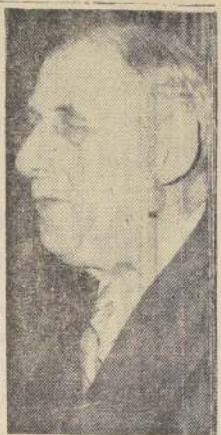
Presidente De Gaulle, cuya política ha determinado una nueva derrota comunista.