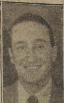
Subsecretario de Relaciones Exteriores, don Manuel Trucco.

Todos los delegados serán invitados a una recepción que ofrecerá en su honor el Rey y la Reina en el Palacio Buckingham.