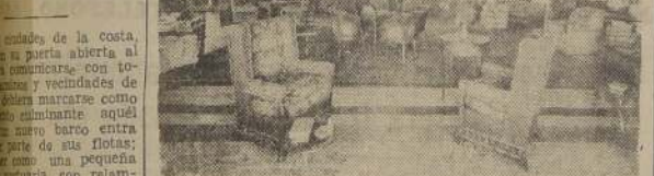
Salón de Fiesta y Gran Hall del "Reina del Pacifico"

QUEDADO EL DEL PACIFICO", AL INICIAR SUS VIAJES