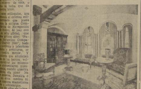
Biblioteca principal del "Reina del Pacifico"

ejercicios físicos. Para niños, no se ha olvidado un salón de recreo, e igualmente un bien instalado Salón de Belleza para damas. Y así puede continuarse en una larga enumeración de salas y tiendas: tres de peluquería para señoras y caballeros, bazares, salas de cócteles, cinco bares y dos cinemas. Si a todo esto se agrega el práctico sistema de comunicación por medio de ascensores, con 6 cubiertas, 3 hospitales y 2 salas de operaciones, se llega a la realidad de lo que anhela el espíritu más exigente. Se ha creado una magnífica ciudad flotante.