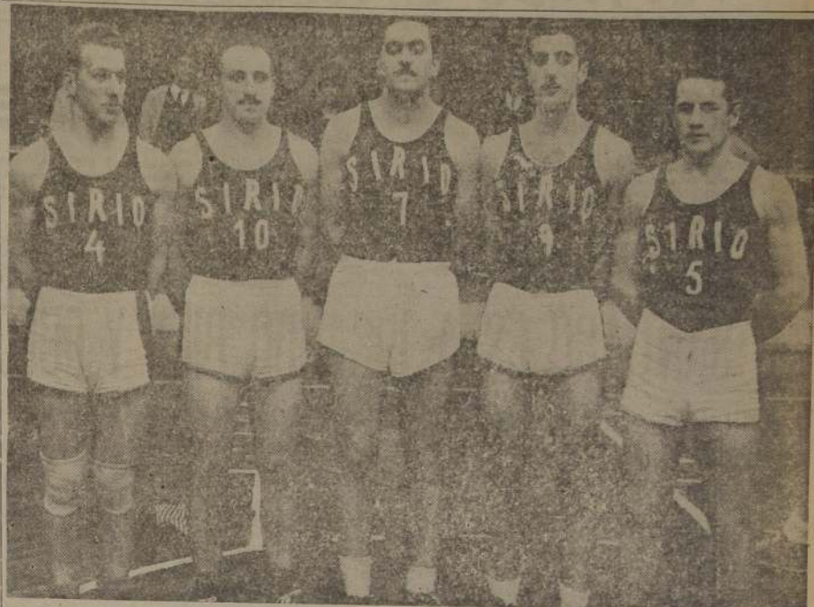
Conjunto del Sirio, rival del Barcelona, en un cotejo que ble n ganado se tiene el calificativo de "clásico" del básquetbol metro politano.

"Las Águilas Humanas", para el viernes próximo, a las 21.30 ho- ras. La administración del Cau- polican, nos encarga comunicar a los aficionados que actuarán en el Campeonato Nacional que en caso de no haber recibido las tarjetas de invitación, pue- den concurrir al Teatro, hacien- do valer su calidad de aficiona- do integrante de una delega- ción.