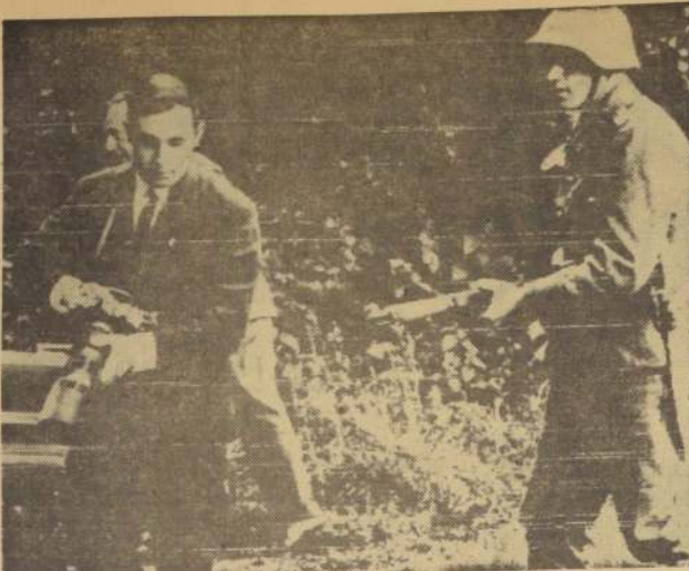
EVIAN-LES-BAINS (Frontera franco-suiza). — Un soldado suizo ordena a un reportero gráfico que porta una cámara con teleobjetivo— se retire de la entrada a la villa de los argelinos rehenes, el 19 de mayo. Un estricto programa de seguridad comenzó a aplicarse en esta aldea en vísperas de la iniciación de conversaciones de paz sobre Argelia entre los rebeldes y el Gobierno francés.

La delegación del Gobierno argelino en exilio —cuya sede