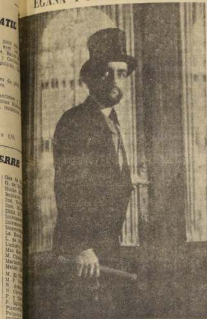
negativo título de "PASIONES SECRETAS", Universal en los teatros Egaña y Pedro de Valdivia, la notable del médico y literato Freud. Con censura, mayores de 16, puede verse esta película admirable, que permite a Montgomery Clift una creación genial.

GRAFIA DE FREUD SE ESTA PROYECTANDO EN LOS CINES EGASA Y PEDRO DE VALDIVIA