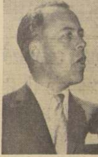
Ministro Enrique Ortúzar