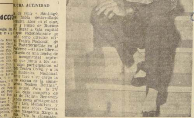
ESTEBAN SERRADOR, una de las grandes figuras del teatro argentino, a quien veremos desde mañana en el Teatro Camilo Henríquez, en la obra policial de Arellano Marin, "Mia es la venganza".

El elenco completo se encuentra en la Sala "Camilo Henríquez" la obra policial en "Mia es la venganza". El día de mañana será actuado en la sala que ocupa actualmente el Teatro de la Universidad Católica, y a la hora de la tarde quedará en de este sitio.