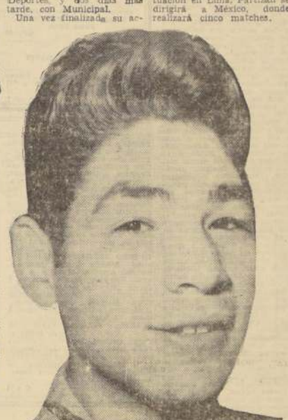
"TORITO", nada concreto, pero existen conversaciones, en torno a su transferencia al River Plate. Sampdoria, dice que no lo vende, pero si lo "alquila", según la información del cable.

LIMA, 2 (UPI). — Llegó el equipo peruano de fútbol Partizán, que disputará aquí tres partidos. En el primero el día 4, enfrentará al campeón local, Alianza Lima. El 7 se medirá con Universitario de