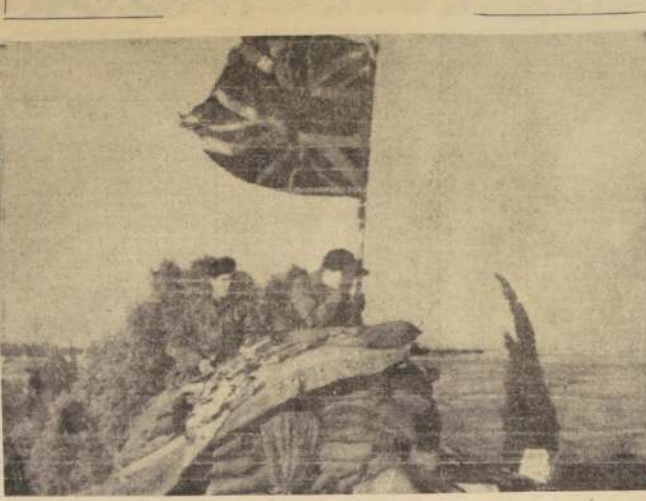
NICOSIA, CHIPRE. — Continúa la tensión en esta isla entre los chipriotas griegos y turcos. Según fuentes oficiales, los movimientos navales que realiza Turquía frente a la isla están siendo puestos de inmediato en conocimiento de la OTAN. En el grabado, un empujamiento de las tropas británicas que están actuando de apaciguadores entre los dos bandos en pugna en esta isla.