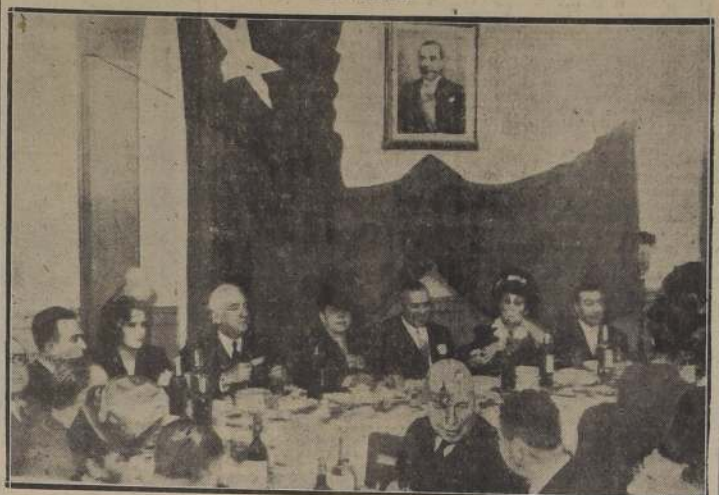
La mesa de honor del banquete ofrecido anoche al señor González Videla