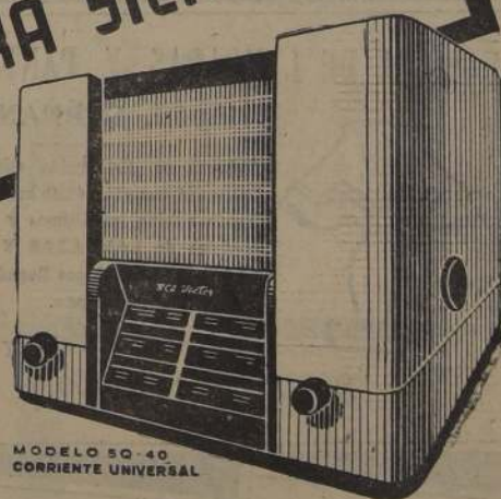
MODELO 50-40 CORRIENTE UNIVERSAL

!MUSICA Y ALEGRIA! PARA ESTAS FIESTAS... Y PARA SIEMPRE!