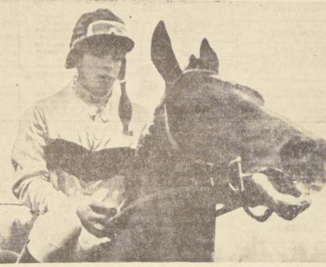
GRAN VITAL, ya está en la Ciudad Jardín preparándose para la Copa Jackson.