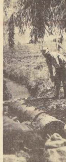
Tierras individuales y en cooperativa recibieron 99 campesinos del Asentamiento "Tranquila" en el valle del Choapa, después de un proceso en que demostraron ser capaces de hacer rendir los predios tan bien o mejor que cualquier agricultor.