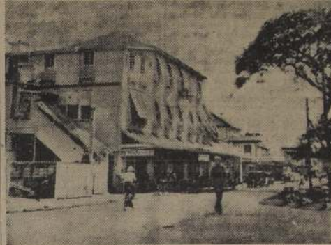
GEORGETOWN (Guayana Inglesa). — La actividad es grande en los periódicos en la capital de la inquieta Guayana Inglesa en estos días. En la foto, se muestra la oficina de uno de los periódicos locales que bulle con la actual crisis política. Gran Bretaña ha enviado buques de guerra y tropas a su única colonia en Sud América para contrarrestar el movimiento del Partido Progresista del Pueblo, que amenaza con apagar el poder colonial británico.