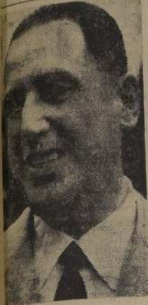
PERON: Orden de Rubén Darío

En esta oportunidad, el Presidente de Nicaragua dijo: "El lazo indisoluble que vincula a la Argentina con Nicaragua, no obedece a la semejanza de nuestros pueblos ni a la comunión en sus prácticas democráticas. Tiene raíces en la espiritualidad de nuestra mayor gloria: Rubén Darío, quien, gracias a vuestra proverbial hospitalidad, se sintió también argentino un día, sin renunciar por ello a su veneración por lo nuestro".