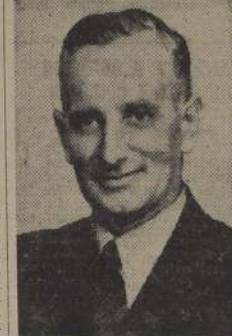
GOBERNADOR DE LA GUAYANA INGLESA. — GEORGETOWN (Guayana Inglesa). — Se espera que se den amplios poderes para restablecer la tranquilidad en la Guayana Inglesa.