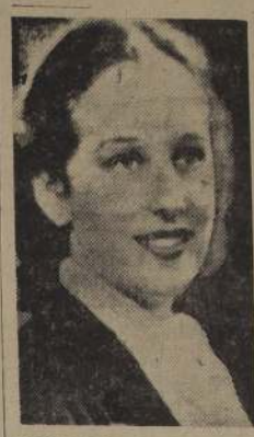
GARY (Indiana). — Janet Jagan