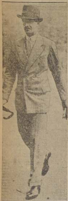
Anthony Eden, Ministro británico para asuntos de la Liga de las Naciones, se ve aquí al salir de Londres rumbo a París, donde se proponía persuadir a los franceses de que Inglaterra no estaba envuelta en la concesión petrolífera de Etiopía. También salió dispuesto a intentar poner a Mussolini a la defensiva en la Liga.