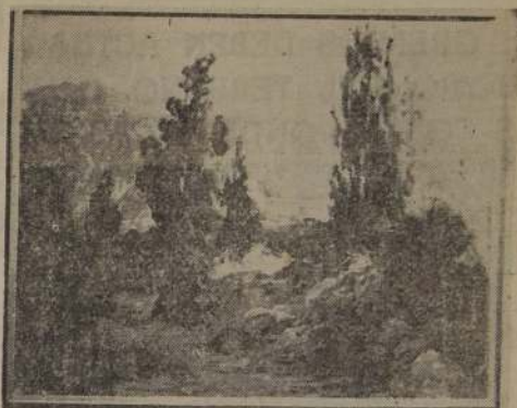
EXPOSICION PASCUAL GAMBINO.—En la Sala de Exposiciones del Banco de Chile se puede admirar los cuadros al óleo de Pascual Gambino, una de las más interesantes exposiciones de los últimos tiempos.—En ella hemos captado un cuadro que ha llamado la atención de los asistentes, se llama "OTOÑO EN LA OBRA", donde se puede ver la precisión del artista para sus motivos.—La clausura de esta exposición está fijada para mañana.

la achicoria, malta, cereales, leguminosas, higos, zanahorias, betarragas, bellotas y demás, que se elaboren o expendan para ser usados o consumidos en bebidas o infusiones alimenticias que se preparan con café, o para reemplazar el café en todo o en parte.