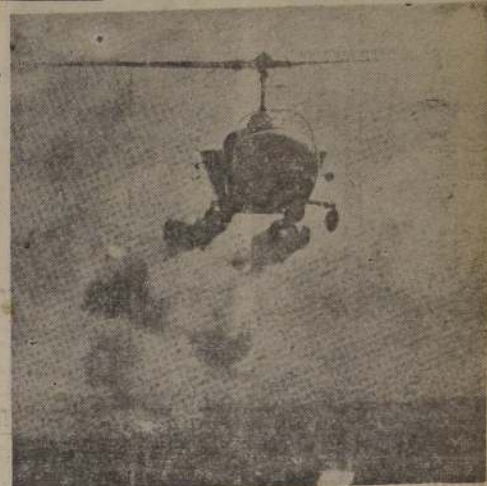
El helicóptero, un auxiliar moderno de los agricultores.

INFECCION.—Señor O. B. V.—Concepción.—La tifa es causada por el hongo Trichopyton tonsurans. Se presenta con mayor frecuencia en los terneros y animales nuevos que se encuentran en malas condiciones, debido a la alimentación inapropiada y malos corrales.