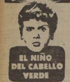
EL NIÑO DEL CABELLO VERDE

PAI O'BRIEN - ROBERT EYAN BARBARA HALE - DEAN STOCKWELL