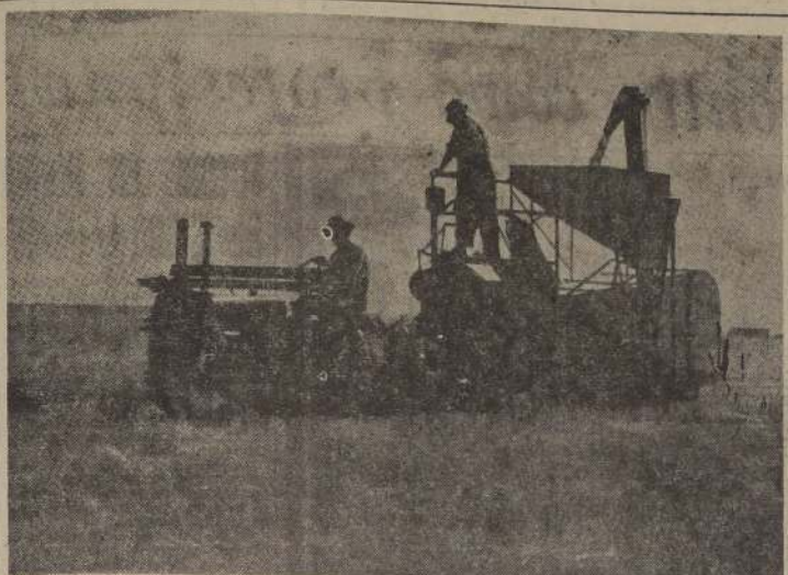
"Mientras la producción de América Latina ha subido apenas un 14 por ciento, la población ha aumentado en un 24 por ciento".

...de la población ...varia, según los dis- ...entre 1 por ciento ...por año; por ...de levantar los ...sección, es menes- ...la producción de al- ...por lo menos un 2 ...por ciento anualmente, ...a una de nueves- ...M. Raymond ...de la Organiza- ...Agrícola y la ...FAO), un ...de las Na- ...en Santiago. M. ...que ha visitado en nu- ...aciones anteriores — ...realizar estudios en ...América como miembro ...Cooperativa FAO- ...Comisión Económica ...Latina de las Na- ...cional).