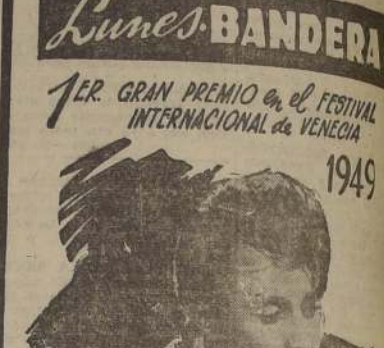
¡Seres envejecidos POR LA GUERRA ES CÉPTICOS POR EL DOLOR ABRAZARON SU AMOR COMO EL UNICO MEDIO DE SALVACION

1ER GRAN PREMIO en el FESTIVAL INTERNACIONAL de VENEZIA 1949