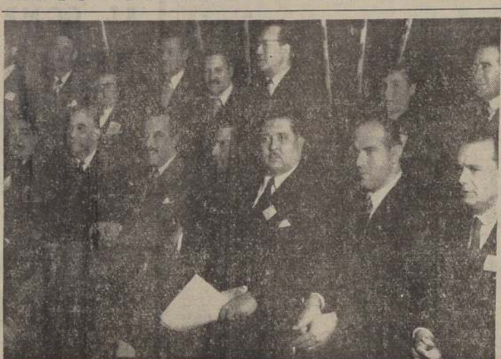
Parte de la mesa de honor en la inauguración de la Segunda Convención