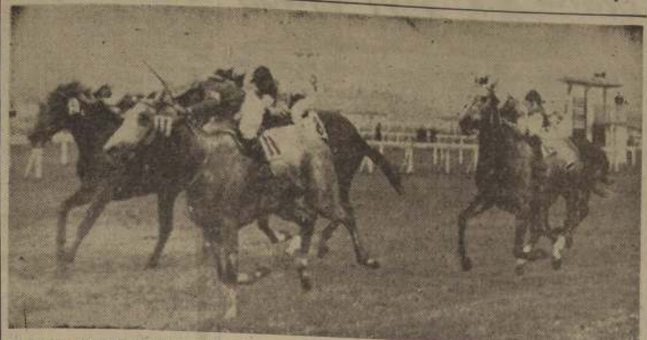
El premio "Emilio Irarrázaval" corrido ayer en el Club Hípico dio oportunidad para presenciar un final bravamente disputado, en donde Oregón, que tuvo desde la salida al mando del pelotón, se defendió valientemente hasta la última vuelta, cuando fue derrotado por Herrador.

En la línea corrieron los favoritos en las primeras vueltas, pero al dar la vuelta a la pista, se adelantó a los demás y, al dar la vuelta a la pista, se adelantó a los demás y, al dar la vuelta a la pista, se adelantó a los demás.