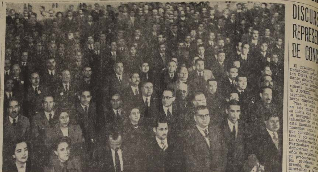
Aspecto parcial de la concurrencia a la inauguración del Segundo Congreso Nacional auspiciado por la Confederación de Empleados Particulares de Chile, en el Teatro Baquedano